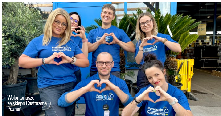
Wolontariusze ze sklepu Castorama Poznań

W Castoramie kultura organizacyjna oparta na wspólnych wartościach jest możliwa, gdyż w centrum uwagi zawsze stawiany jest człowiek – pracownik i klient. Relacje wewnątrz firmy oparte są o partnerskie więzi na każdym poziomie. Powszechnie jest chociażby zwracanie się do siebie po imieniu bez względu na stanowisko czy miejsce pracy. Już na etapie rekrutacji Castorama poszukuje osób, które wykazują się zaangażowaniem, otwartością na współpracę i chęcią nauki. W ten sposób buduje zgrany zespół, który naturalnie tworzy przyjazną atmosferę pracy i wspiera tworzenie pozytywnych doświadczeń pracownika i klienta. Duże znaczenie dla relacji w zespole ma również możliwość angażowania się w projekty wolontaryjne. W Castoramie każdy ma do dyspozycji 24 godziny w ciągu roku na udział w dowolnym, wybranym przez siebie projekcie. Pracownicy Castoramy charytatywnie angażują się w projekty nie tylko Fundacji Castorama , związane z zapewnieniem dobrych warunków mieszkaniowych, ale też te na rzecz ochrony środowiska, zwierząt czy pomocy ofiarom klęsk żywiołowych. Tylko w 2023 roku,