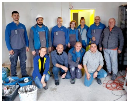
Wolontariusze Fundacji Castorama ze sklepów Castorama Chorzów i Castorama Bytom podczas realizacji projektu w Miejskim Domu Pomocy Społecznej Złota Jesień w Świętochłowicach

Siłą firmy stanowi zespół składający się z osób o różnych doświadczeniach, perspektywach i umiejętnościach, a kluczem do sukcesu jest słuchanie głosu wszystkich pracowników. Obok prowadzonego już regularnie, dwa razy w roku Badania Zaangażowania, Castorama prowadzi dialog na bieżąco, dzięki funkcjonującej od blisko 20 lat Radzie Pracowników. Rada wybierana jest na czteroletnią kadencję. To z jej przedstawicielkami i przedstawicielami pracodawca jest w bieżącym kontakcie, informuje o strategii, planach biznesowych i konsultuje wszystkie ważne projekty i zmiany dotyczące organizacji pracy.