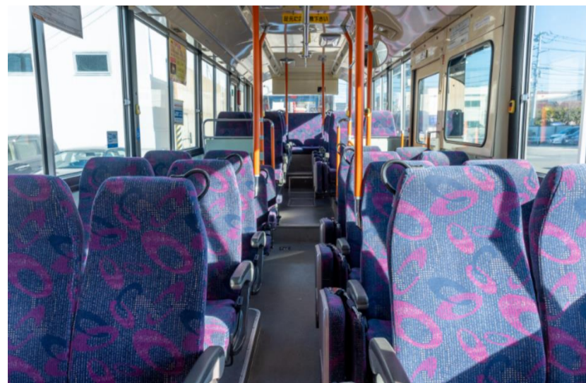
ロマンスシートタイプ車内一例