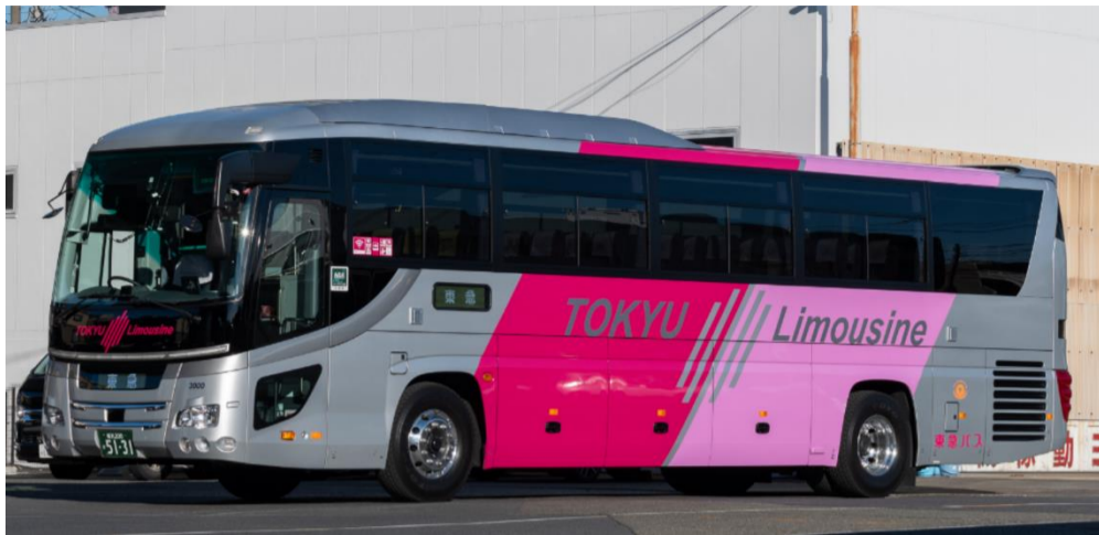
リムジンバスタイプ車両一例

空港・高速路線タイプ …空港連絡バス・高速バスで使用している車両です。観光バス同型車で中・長距離のご移動も快適にお過ごしいただけます。 (観光バス同型車) (正座席38~49席程度)