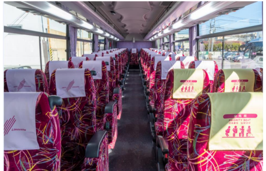
リムジンバスタイプ車内一例

少人数のご移動が適したマイクロ車両等、その他車両のご用意もございます。詳しくはお問い合わせください。