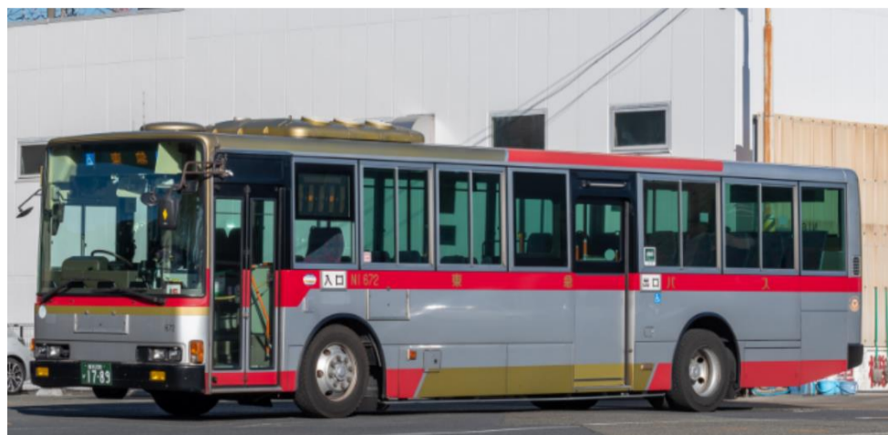
ロマンスシートタイプ車両一例

ロマンスシートタイプ …中距離用に前向きにシートが設置された車両です。 立ち含め約50～60名様程がご乗車可能（正座席40～50席程度）