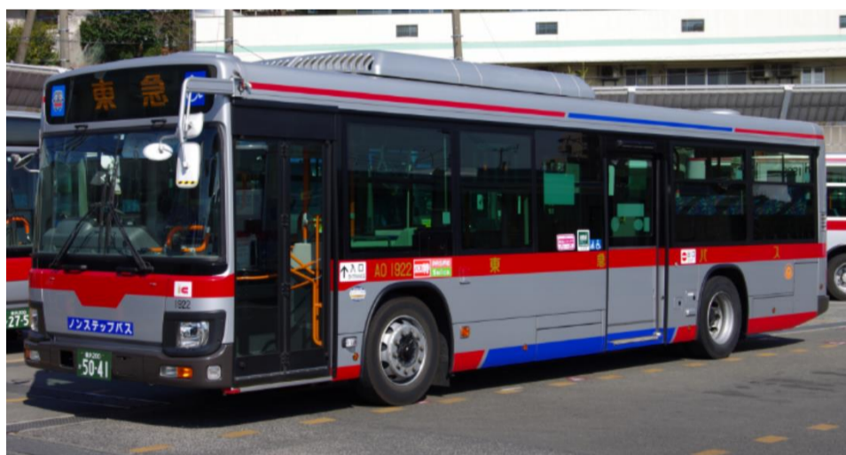
路線バス大型車両一例

一般路線大型バス …立ち含め約60～70名様程がご乗車可能（正座席20～30席程度）