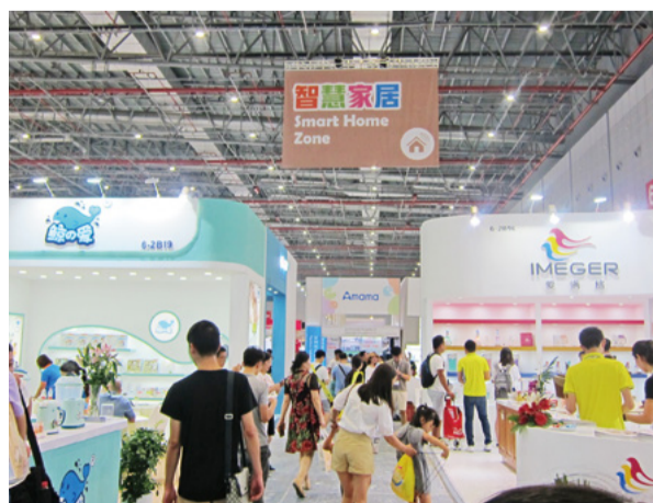
▲ Hall 6.2 中設立了新亮點展區「智慧家居」，會員廠商匯嘉健康生活科技公司亦於此區展出

本會於 4.1 館國際展團區籌組台灣廠商參展，藉由國貿局專案補助，結合台灣孕嬰童用品廠商，透過「台灣第一等」形象 LOGO 醒目整體形象，展示創新優質產品，提供不僅中國內地市場，還有全球性買主更多元的台灣高品質及差異化產品，協助台灣廠商拓展中國內地及全球市場與商機。