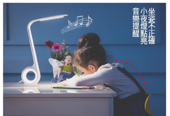
持續9s出現低頭、彎腰、塌背等不良姿勢，音樂響起，小夜燈點亮