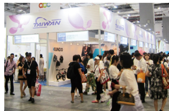
▲ 本會於 Hall 4.1 國際館籌組台灣團區參展，藉由國貿局專案補助，以「台灣第一等」整體形象豪華特裝，展示創新優質產品

而全球產業中國仍然為仿冒最大發生國，中國上海當局及主辦單位鑑於本問題，發起了「保護智慧財產權，鼓勵自主創新」，於本次展覽由主辦單位博聞中國與上海博物館、上海長寧區文化局主辦，以上海博物館提供的「10 大國寶級館藏文物」為設計元素，圍繞著「當過去遇上未來」的設計主題舉辦了「海上文博 2018 上海創意設計大賽」，揭曉了 42 強「童