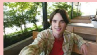
広範囲を撮影でき、空間を広く見せることができる