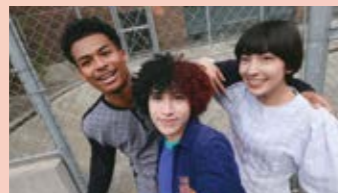
複数人での自撮りも画角に全員おさまる