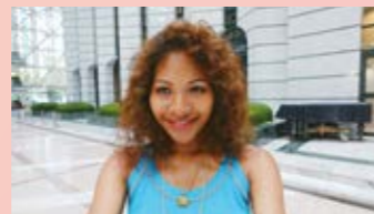
背景もしっかり入れて被写体を撮影できる