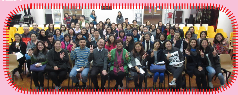
菜姨姨與鍾校長及家長們一起大合照