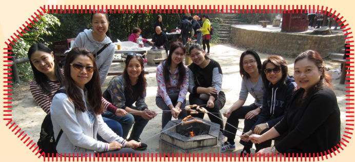
輕輕鬆鬆、睇睇心心燒烤樂！