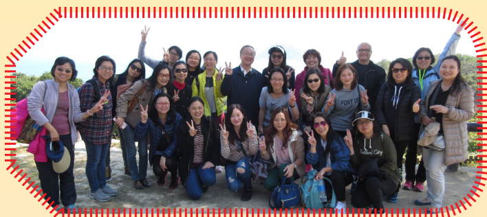
在優美的環境下，大家歡度了愉快的一天！