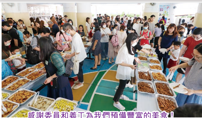
感謝委員和義工為我們預備豐富的美食！