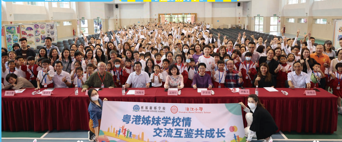
兩校師生和家長，來個大合照。