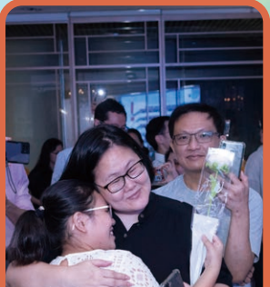
家教會為每位畢業生預備了禮物，讓他們送給父母親。