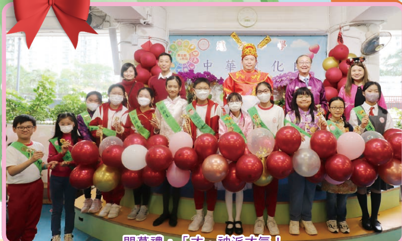
開幕禮，「才」神派才氣！