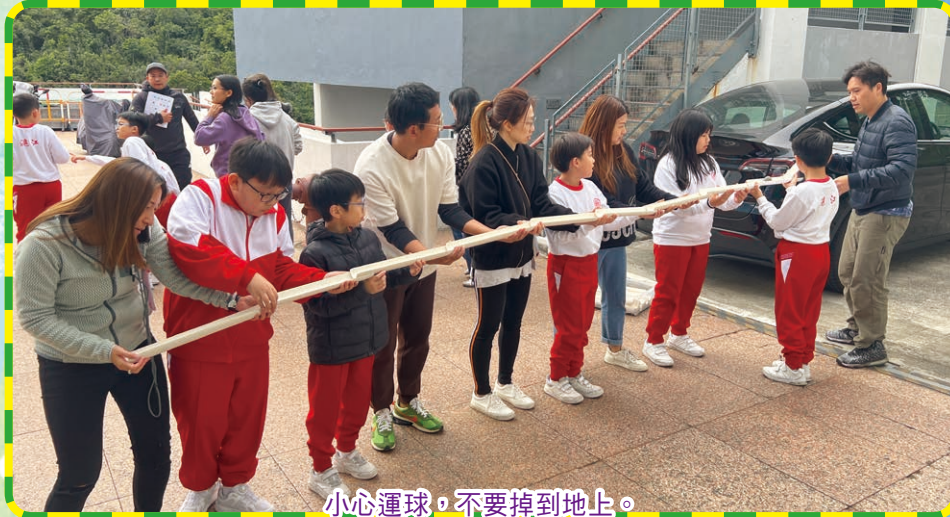
小心運球，不要掉到地上。