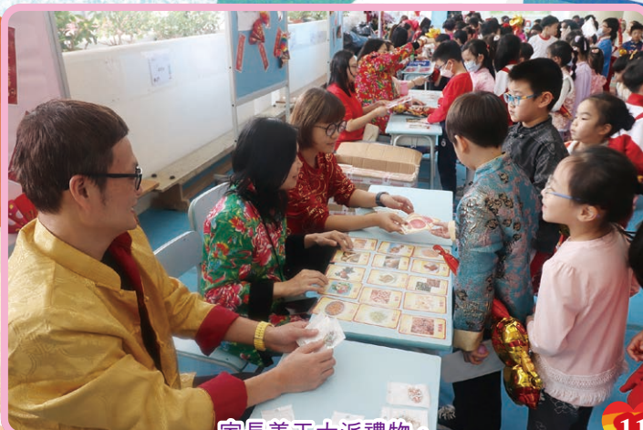
家長義工大派禮物。