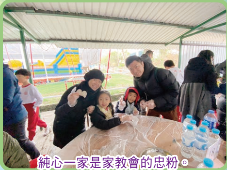
純心一家是家教會的忠粉。