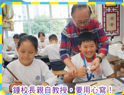
鍾校長親自教授，要用心寫！