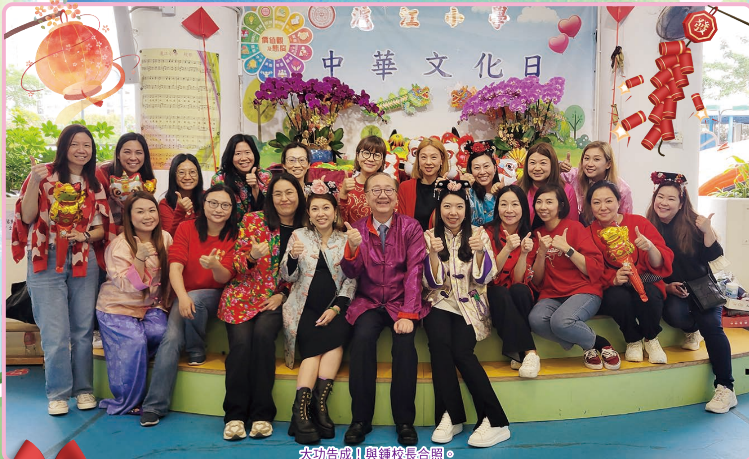
大功告成！與鍾校長合照。