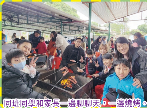
同班同學和家長一邊聊聊天，一邊燒烤。