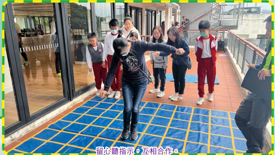
留心聽指示，互相合作。