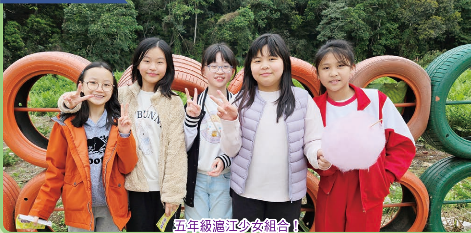
五年級滬江少女組合！