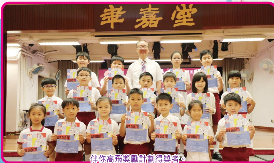
伴你高飛獎勵計劃得獎者。