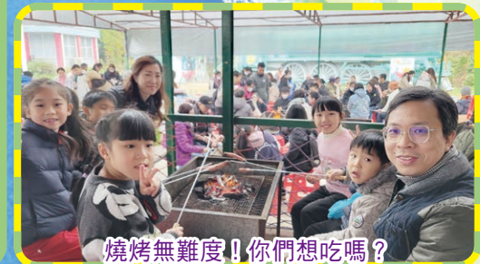
燒烤無難度！你們想吃嗎？