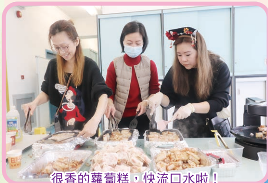
很香的蘿蔔糕，快流口水啦！