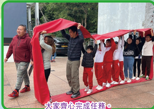
大家齊心完成任務。