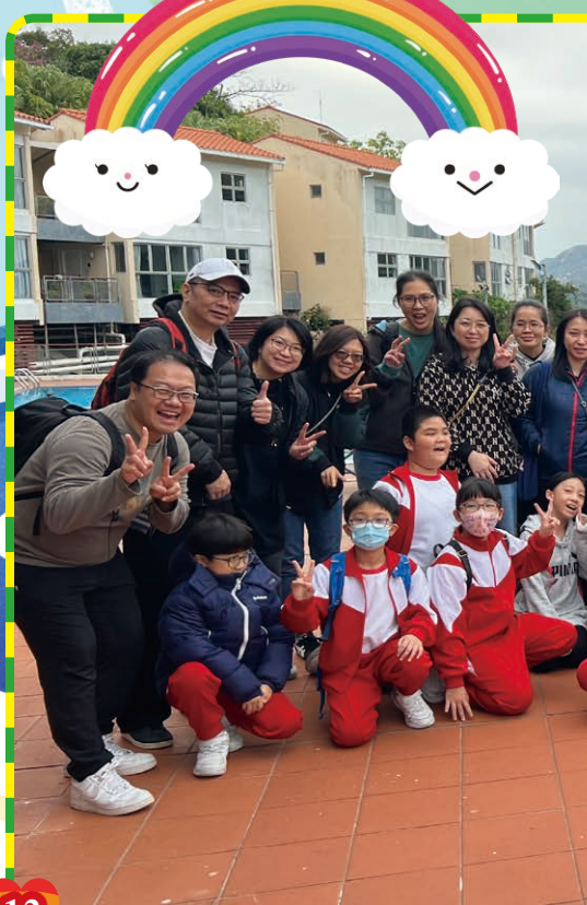
鍾校長來為我們打氣！