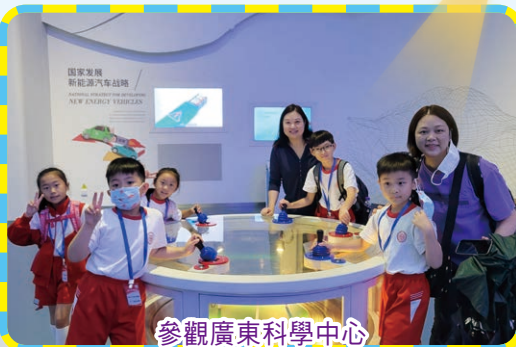
參觀廣東科學中心