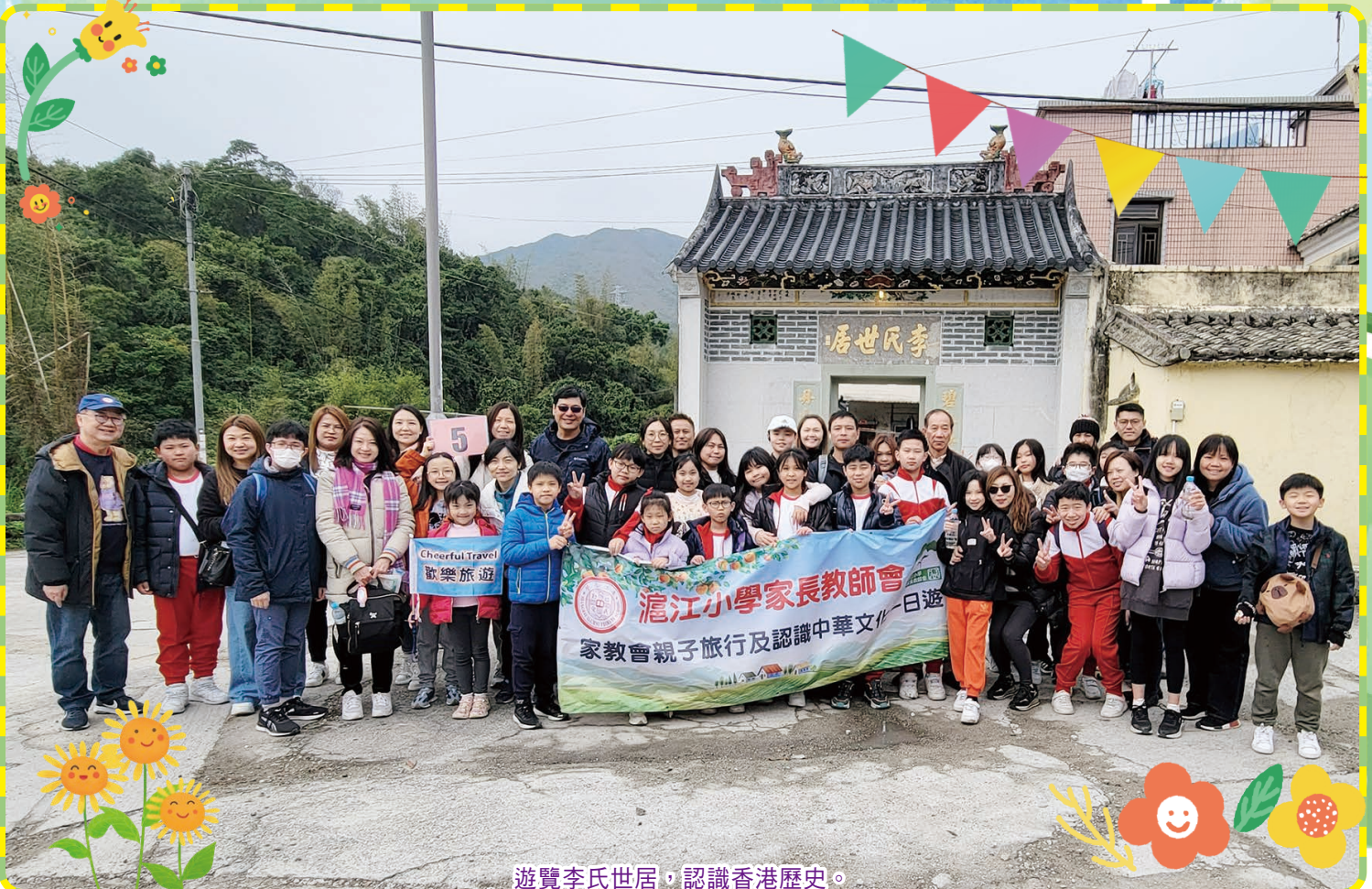
遊覽李氏世居，認識香港歷史。