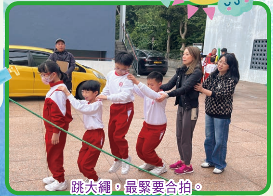
跳大繩，最緊要合拍。