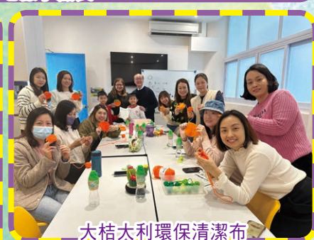
大桔大利環保清潔布