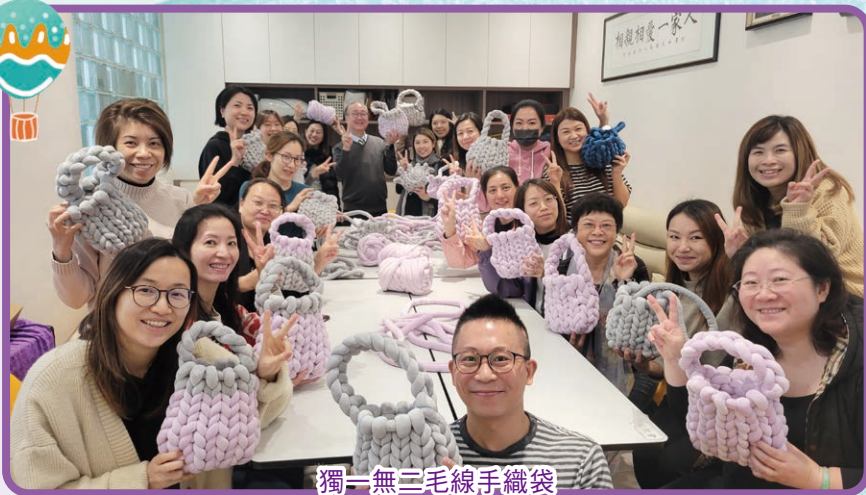
獨一無三毛線手織袋

我們開辦多個家長活動讓家長可以輕鬆一下，今年有教大家煮酥脆Q彈的蝦多士、手織時款手袋、療癒身心的酒精水墨畫及香磚製作等。當然，家長義工跟鍾校長燒烤也是每年的重點之一。我們會繼續開辦更多的活動，希望大家踴躍參加吧！