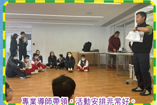
專業導師帶領，活動安排非常好。