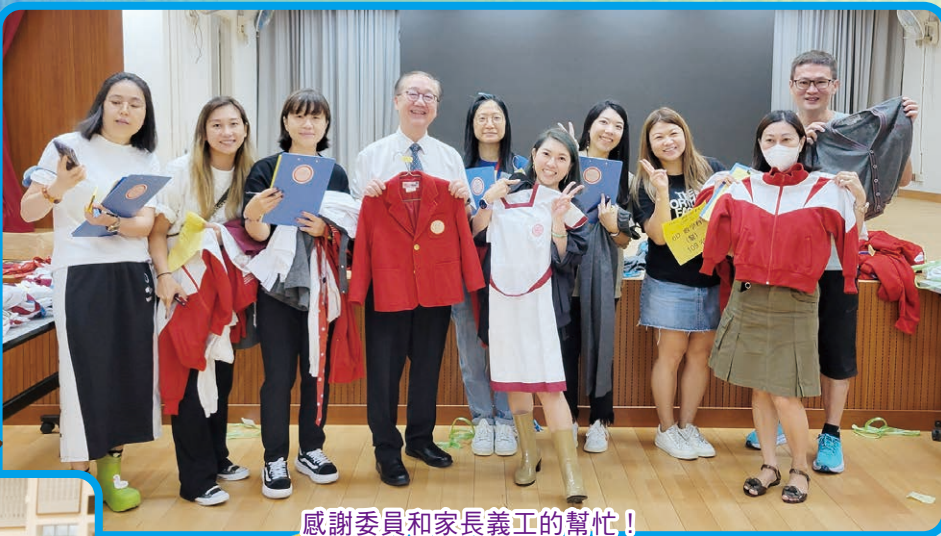
感謝委員和家長義工的幫忙！