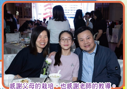
感謝父母的栽培，也感謝老師的教導。