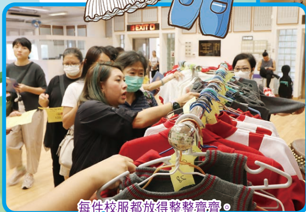
每件校服都放得整齊齊。