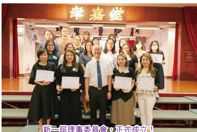
新一屆理事委員會，正式成立！

我們於2023年5月20日（星期六）舉行了「第33屆2022-2023年度家長教師會會員大會」，通過會務報告、審核財政收支及「第34屆家長教師會委員名單」。我們還安排了自助餐，感謝各位家長支持我們。