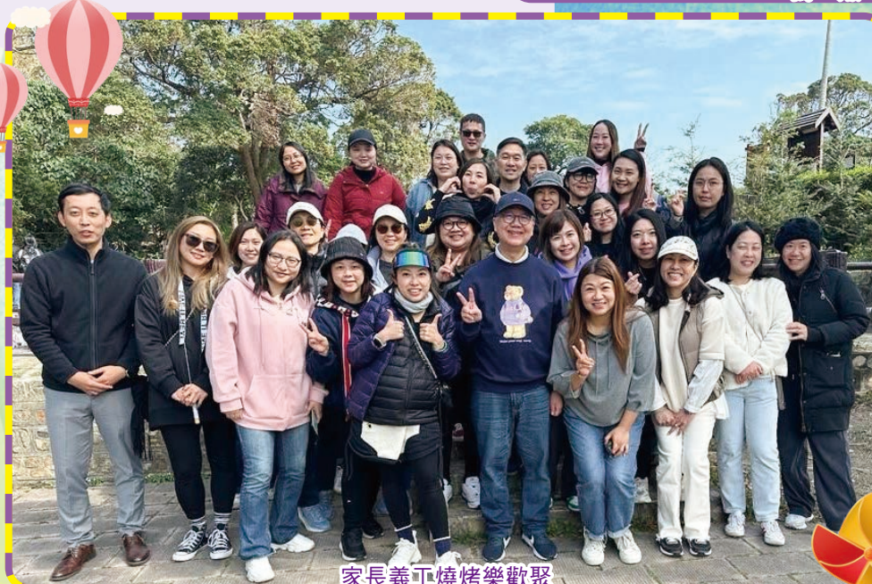
家長義工燒烤樂歡聚