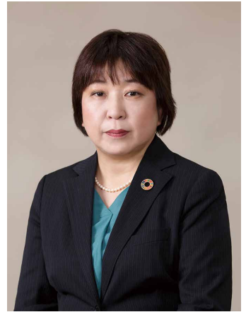
日本労働組合総連合会東京都連合会

連合東京は、2024～2025年の運動のスローガンを「連帯・共助・平和 ～社会を変える組織力の結集 ところをつなぐ運動の推進～」としました。持続可能な運動・活動の推進に向け、連合東京が「必ずそばにいる存在」として連帯の輪をひろげ、労働組合の社会的役割を発揮しながら、平和や共助に根ざした連合運動を展開していきます。