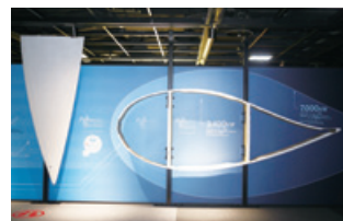
風車ブレードの実物展示