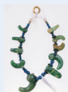
首飾り(勾玉：古墳時代)

北海道の名付け親として有名な探検家・松浦武四郎(1818~88)旧蔵の考古遺物の中から主要なものを選り、初公開いたします。