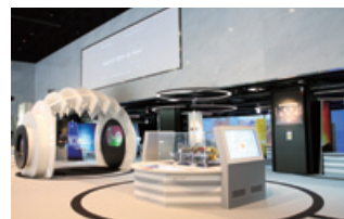
エネルギーを知り、考える

“エネルギーの多様性”をテーマに、三菱重工が手掛ける各種の発電方式について映像や実物・模型展示で詳しく紹介しています。子どもから大人まで、便利なくらしを支えるエネルギーについて、楽しく分かりやすく学ぶことができます。