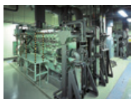
コージェネレーションシステム

当事業本部では、自動車の燃費を向上させるターボチャージャー、排ガス規制に適合した船舶・産業車両搭載用エンジン、電気や熱といったエネルギーの有効利用を実現するガスエンジンコージェネレーションシステムなど、環境にやさしい「ものづくり」に取り組んでいます。