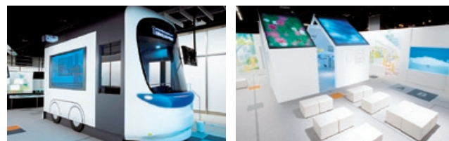
交通・輸送ゾーン“ぴったり tram” くらしの発見ゾーン“ぴったりホーム”

技術がつくる、エコで快適な社会「ぴったりコミュニティ」をテーマに、地球に優しい地域社会を実現する社会システムであるスマートコミュニティと、それを支える技術を紹介しています。