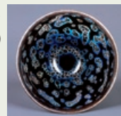
国宝「曜変天目(稲葉天目)」南宋時代

世に3碗伝わる国宝の曜変天目のうちの一碗「稲葉天目」をはじめ、油滴天目など、館蔵茶道具の名品を出品いたします。