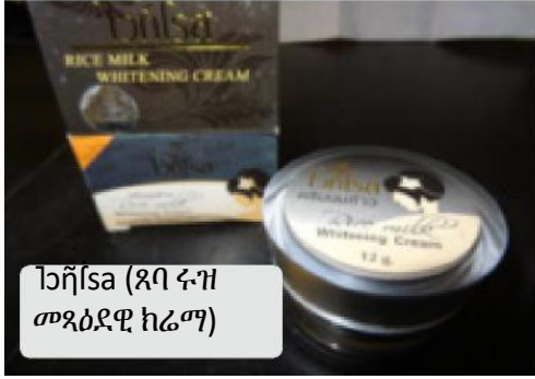
ጎናቫሌ (ጸባ ፍዝ መጻዕደዊ ክሬም)

እዞ ምሉእ ዝርዝር ኣይኮነን። ብዙሓት ኣብ ሚኒሶታ ዝተመርመሩ ውጽኢታት ሜርኩሪ ከምኡ ድማ/ወይ ካልእ ቀማማት ነይርዎም። ንተወሰኹቲ ኣብነታት ናብ health.state.mn.us/topics/skin ብጽሑ