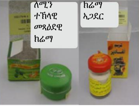
ለሚን ተኸላዊ መጻዕደዊ ክሬም