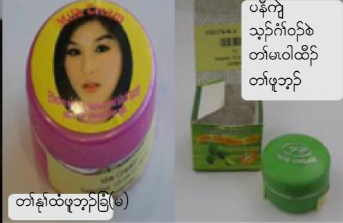
တၢ်န့ၢ်ထံဖူဘၣ်ခြံ(မ)

ပနီၣ်ကျဲ သ့ၣ်ဂံၢ်ဝၣ်စ တၢ်မၤဝါထီၣ် တၢ်ဖူဘၣ်