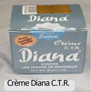
Crème Diana C.T.R.