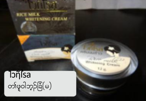
ဘၢ်ါသာ တၢ်ဖူဝါဘၣ်ခြံ(မ)

မၢ်အိၣ်ဒီးခသၣ်သါအါထီၣ်အဂီၢ်ကွၢ် health.state.mn.us/topics/skin