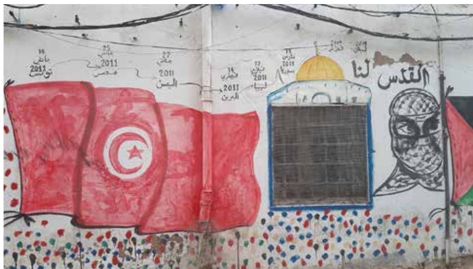
Bild unten: »From Tunisia to the Arab World« – Graffiti in der Medina von Tunis, dem historischen Zentrum der tunesischen Hauptstadt.

Bild links: Im Februar 2022 demonstrieren tunesische Männer und Frauen in Erinnerung an die Ermordung des linken Oppositionsführers Chokri Belaïd in Tunis.