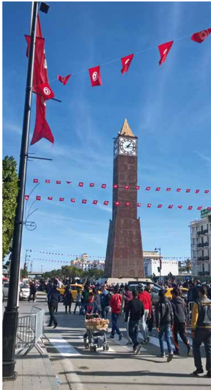
Stadtzentrum von Tunis am 14. Januar 2016: Der fünfte Jahrestag der Flucht Ben Alis, des durch die Revolution vertriebenen Autokraten, nach Saudi-Arabien trieb viele Menschen auf die Straßen.

Aus humangeografischer Sicht weist das grenzüberschreitende Geschäft mit der Gesundheit eine Vielzahl von Aspekten auf. Stichworte sind die wachsende Ungleichheit, die gesamtwirtschaftliche Entwicklung, die Rolle formeller und informeller Ökonomie, sowie der Spitzenbiotechnologie, aber auch Fragen nach restriktiver europäischer Grenzpolitik, internationaler Mobilität und neuen Möglichkeiten der Digitalisierung. Jedenfalls verdient dieses bislang wenig sicht-