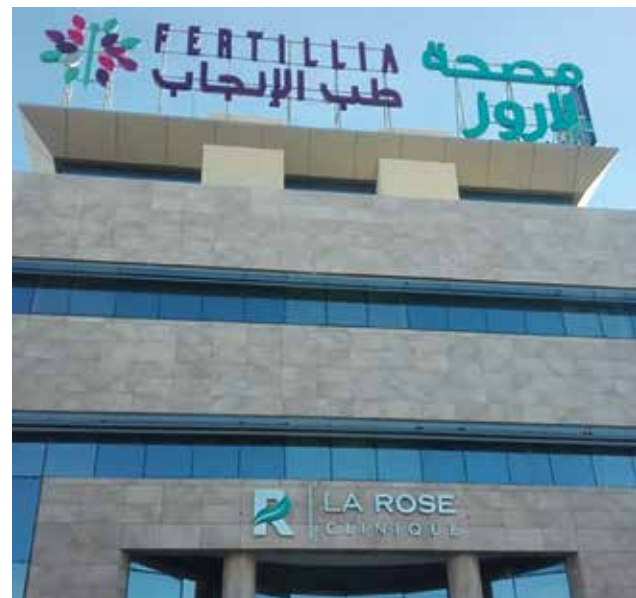
Tunesische Privatkliniken wie das Krankenhaus mit Notaufnahme in Djerba (links) oder das Kinderwunschzentrum in Tunis (rechts) sind begehrt bei ausländischen Patientinnen und Patienten.

Trotz aller Probleme im Land sind die Tunesierinnen und Tunesier stolz auf ihre Revolution. Tunesien ist das einzige Land der Revolutionen, das sich in eine demokratische Richtung entwickelt hat. In Tunesien haben sich über das vergangene Jahrzehnt eine (relativ) freie Presse, eine aktive Zivilgesellschaft und eine äußerst lebendige und kritische Kunst- und Kulturszene herausgebildet. Die wirtschaftliche Lage bleibt jedoch angespannt. Die wirtschaftliche Perspektivlosigkeit, vor allem für die junge Bevölkerung, und die anhaltende Korruption rücken erneut die Frage nach Würde in den Vordergrund.