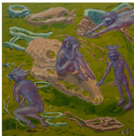
Craniet 2" , olje/lerret 90x90cm, 2023