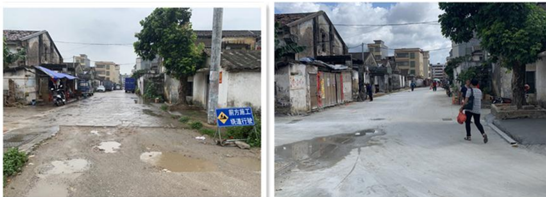
图 2：恩平市大槐镇华侨农场内的联谊路施工前后对比图

受到了群众的一致好评。联谊路位于农场老职工生活区内，环境较偏僻，道路坑洼不平、破旧不堪、排水设施堵塞，下雨天经常出现水浸街现象。此次道路改造重新铺设排水设施，有效解决雨天路面积水严重的问题，保障了群众出行安全。