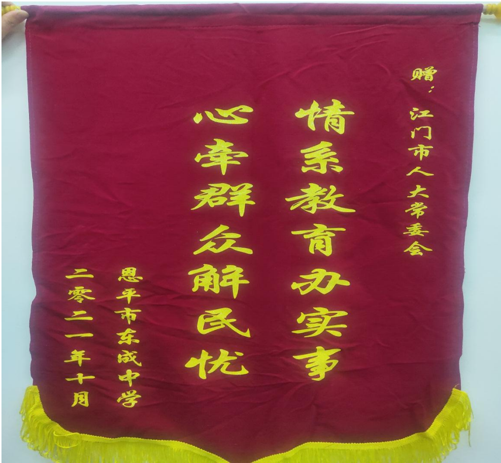
图 3、图 4：东成中学发来感谢信和锦旗

（四）社会维度：努力构建“共建共治共享”基层社会治理新格局，以“泄压阀”功能，化解矛盾风险，增进社会和谐。随着经济社会的快速发展，生活节奏、竞争压力不断增加，人们急需一些发声的渠道表达意见的平台作为情绪的“宣泄口”。民生“微实事”以群众需求为导向，快速解决群众身边的“小急难”，成为一条通向政府和人民之间的高速公路，疏通了老百姓的“心头病”，使人大成为群众意见的集散地，使代表成为解决问题的智囊团，充分发挥了促进社会和谐稳定的“泄压