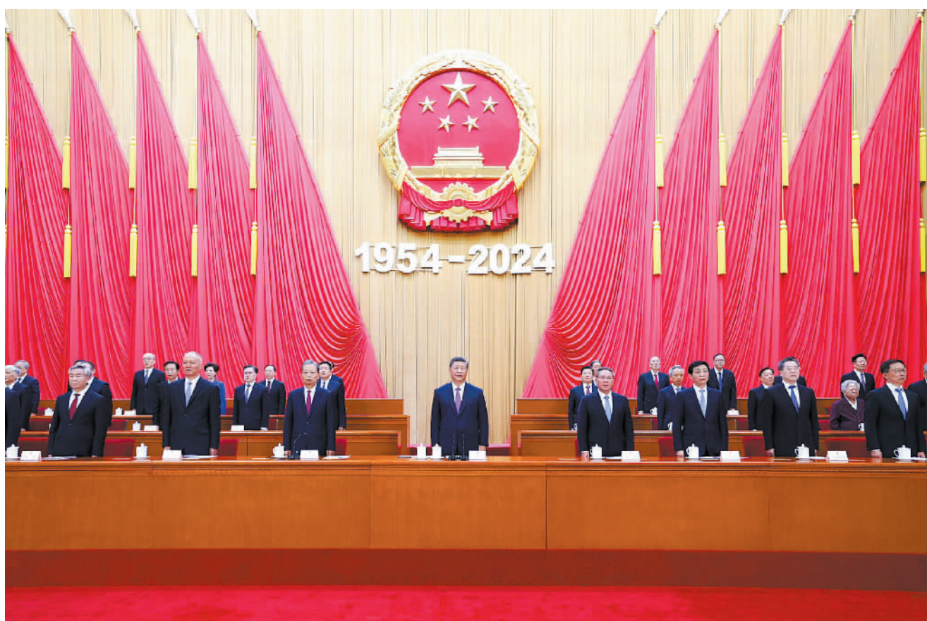
9月14日上午，中共中央、全国人大常委会在北京人民大会堂隆重举行庆祝全国人民代表大会成立70周年大会。习近平、李强、赵乐际、王沪宁、蔡奇、丁薛祥、李希、韩正等出席大会。

新华社北京9月14日电 中共中央、全国人大常委会14日上午在人民大会堂隆重举行庆祝全国人民代表大会成立70周年大会。中共中央总书记、国家主席、中央军委主席习近平出席会议并发表重要讲话。他强调，要进一步坚定道路自信、理论自信、制度自信、文化自信，发展全过程人民民主，坚持好、完善好、运行好人民代表大会制度，为实现新时代新征程党和人民的奋斗目标提供坚实制度保障。