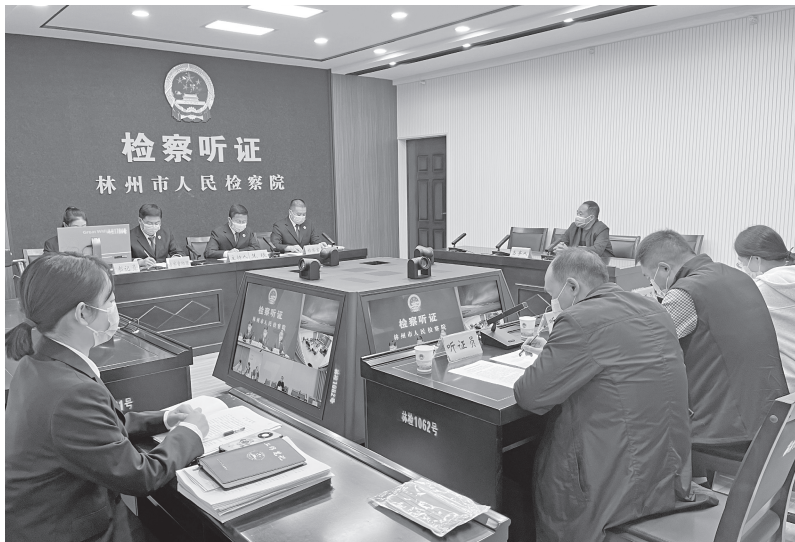
林州市检察院检察长主持公开听证，邀请听证员参与案件讨论

一致时，检察官应该将人民监督员意见层报检察长决定，检察长认为有必要的，可以提请检委会对不同意见进行审议后处理，并将相关结果向人民监督员反馈。