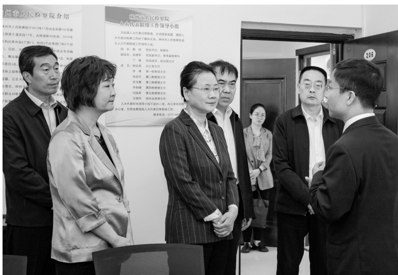
安阳市人大常委会主任徐家平到林州市人民检察院调研全过程人民民主示范点创建工作

林州市人民检察院将创建全过程人民民主示范点作为践行全过程人民民主重大理念的具体实践，通过理念指引、制度保障、硬件支撑、司法实践等多种角度，全方位打造林检样板，使全过程人民民主更加立体化、具体化、实质化。该院被林州市人大常委会确定为“全过程人民民主安阳市级创建示范点”，“践行全过程人