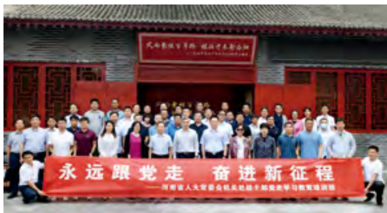
在洛阳市红色教育基地开展党史学习教育

八路军驻洛办事处是抗战期间中国共产党在豫西地区的“红色枢纽”，被命名为全国爱国主义教育示范基地、河南省党史教育基地。在八路军驻洛办事处纪念馆，全体党员干部参观了“风雨兼程百年路