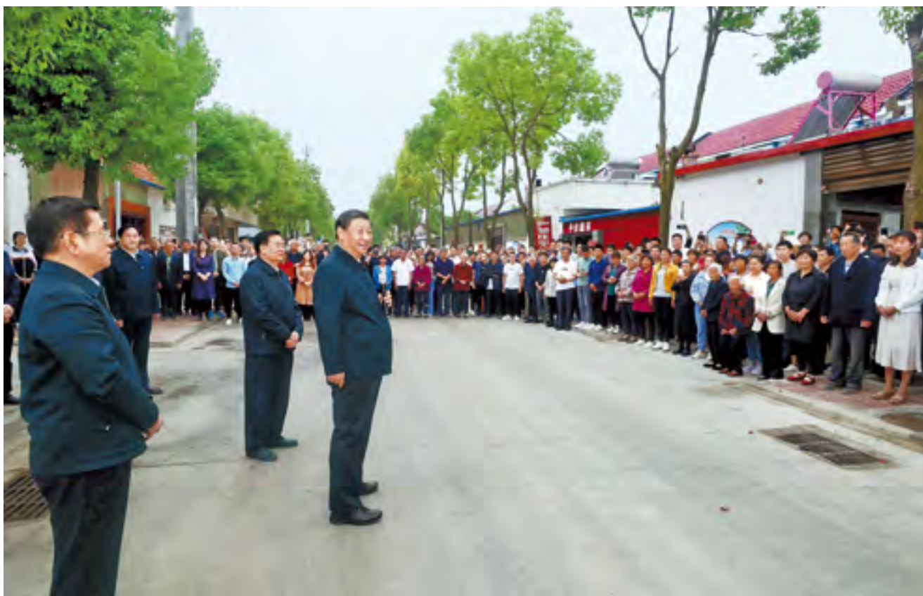
5月14日上午，中共中央总书记、国家主席、中央军委主席习近平在河南省南阳市主持召开推进南水北调后续工程高质量发展座谈会并发表重要讲话。这是座谈会前，习近平于13日在南阳市淅川县九重镇邹庄村考察时，同因工程建设搬迁到这里的村民们亲切交流。