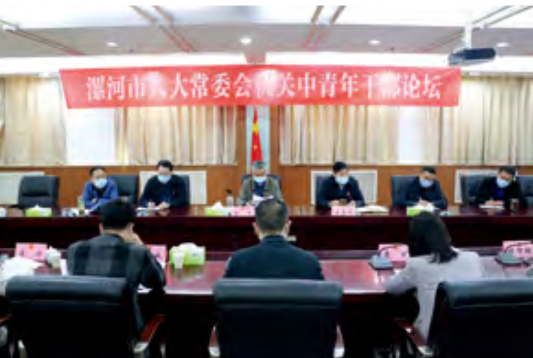
漯河市人大常委会机关举办中青年干部论坛

树立良好作风。 严格落实中央八项规定及其实施细则精神和省、市具体要求，用好监督执纪“四种形态”，巩固、提升深入纠“四风”、持续转作风行动，采取不打招呼、直击现场的方式，督导检查机关纪律作风情况，引导干部树牢纪律意识和规矩意识，“马上就办、求真务实、站前走先、勇争一流”成为人大机关新的风向标和工作基点。