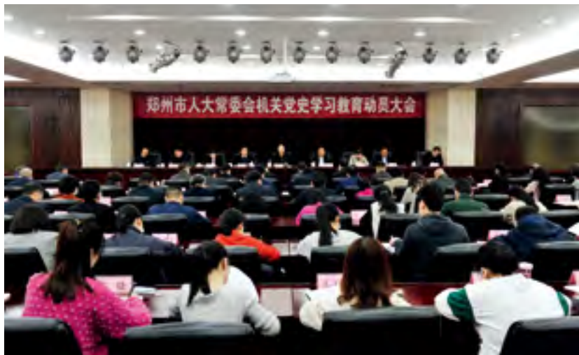
郑州市人大常委会机关党史学习教育动员大会召开

2021年3月12日，在郑州市人大常委会机关党史学习教育动员大会上，市人大常委会党组书记、主任胡荃对机关党史学习教育工作作出动员部署，正式拉开了机关党史学习教育的序幕。“起步就要提速，开局就要争先。”胡荃对机关如何开展党史学