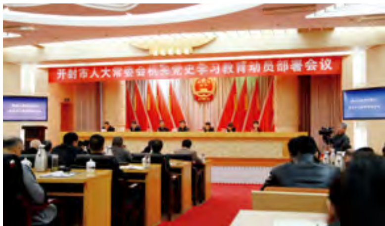
开封市人大常委会机关召开党史学习教育动员部署会议

对地方人大及其常委会来说，做到学史明理，就是要通过学习党史，弄明白中国共产党为什么“能”、马克思主义为什么“行”、中国特色社会主义为什么“好”的基本道理，自觉加强理论武装，不断增强政治判断力、政治领悟力和政治执行力。一是要在学史明理中领悟坚持中国共产党领导的历史必然性。认清没有中国共产党领导，就没有新民主主义革命和社会主义革命的伟大胜利，就没有社会主义建设的伟大探索，就没有改革开放的伟大成就，就没有中华民族伟大复兴的光明前景，从中感悟党的初心、理解党的使命，不断深化对中国共产党为什么“能”的认识。二是要在学史明理中领悟马克思主义及其中国化创新成果的真理性。认清马克思主义是科学的理论、人民的理论、实践的理论、不断发展的开放的理论，其中国化创新成果是我们党立足中国实际和时代发展进行的理论创造，是鲜活管用的马克思主义，从中感悟马克思主义及其中国化创新成果真理力量和实践力量，不断深化对马克思主义为什么“行”的认识。三是要在学史明理中领悟中国特色社会主义道路的正确性。认清中国特色