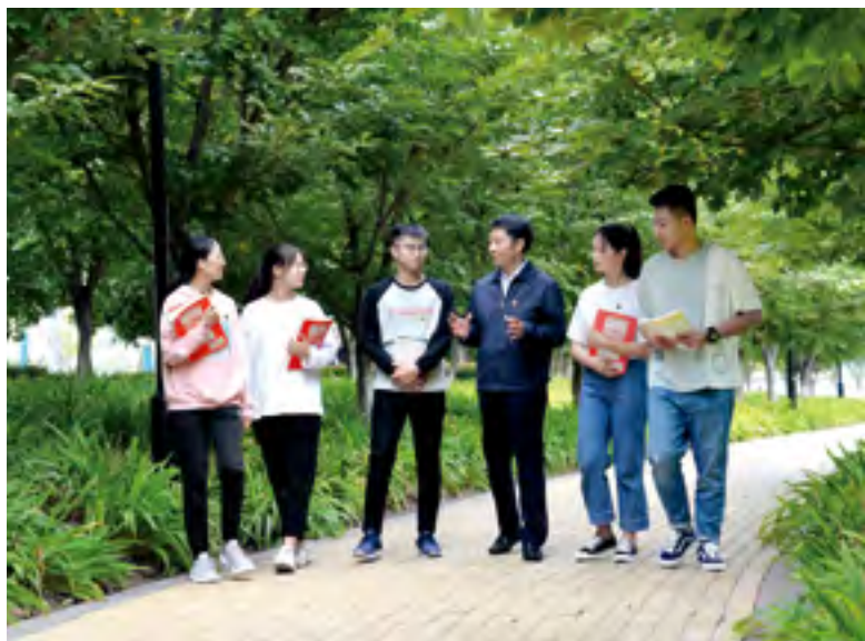
河南省人大代表、洛阳师范学院党委书记王洪彬与青年大学生交流

乡村教育也是王洪彬一直关注的话题。他所在的洛阳师院是豫西地区培养基础教育教师的“摇篮”。