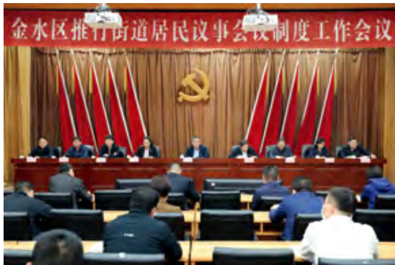
郑州市金水区召开推行街道居民议事会议制度工作会议

事会议议事规则》和《街道民生实事项目票选实施办法》等制度样本，对代表推选、会议组建、议事成员的任期和资格终止、非会议期间活动的组织形式、意见建议的处理办法等作出明确规定，便于各街道规范化开展工作。区人大常委会印发《关于召开街道居民议事会议第一次会议的指导意见》《关于召开街道居民议事会议第二次会议的指导意见》，对各街道第一届居民议事会议第一次会议、第二次会议的举行方式、内容和流程进行了统一规范，要求第一次会议审议通过街道居民议事会议议事规则(草案)、街道民生实事项目票选实施办法(草案)，第二次会议听取街道年度经济社会发展情况通报、票选民生实事并提出意见、建议。