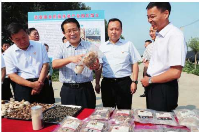
河南省人大代表、漯河市委书记蒿慧杰到舞阳县孟寨镇代表联络站开展“访民情、解民忧”活动

助力脱贫、促进振兴。市人大常委会组织各级人大代表开展“助力脱贫攻坚、助力乡村振兴，人大代表在行动”主题活动，通过网上动态交流和召开现