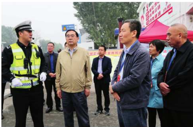
济源市人大常委会组织代表视察道路交通安全工作

推动《河南省旅游条例》贯彻落实，稳住经济发展基本盘，兜牢民生底线。落实示范区党工委暨市委人大工作会议精神和《关于加强新时代人大工作和建设的实施意见》，深入推进“智慧人大”、代表联络站建设等改革事项，为促进经济社会发展和民主法治建设提供人大保障。