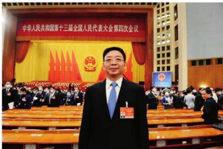
全国人大代表、郑州银行董事长王天宇参加十三届全国人大四次会议

兰考地区业务主办行、商丘分行为扶贫小额贷款主办行。兰考支行自2019年12月开业以来，创建扶贫小额贷款主办行、乡村振兴专项考核等工作机制，与兰考大数据局进行数据对接，深度融入普惠金融改革大潮中。截至2020年12月末，郑州银行在兰考地区投放贷款达53.9亿元，其中，支持民生、重大项目建设等贷款累积投放达53.5亿元。2020年5月，郑州银行兰考支行荣获“支持地方发展先进单位”称号，对当地经济发展的贡献得到政府部门的肯定。