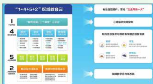
“智慧教育云平台综合解决方案”