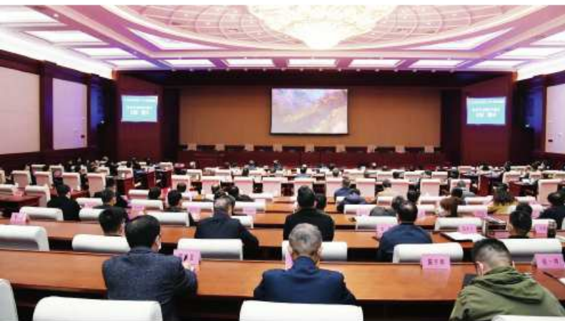
河南省人大常委会机关党员干部集中观看专题片《征程》

大家纷纷表示，通过此次专题学习，对党史学习教育有了更加全面的认识、深入的理解、深刻的把握，增强了学习的自觉性和主动性，将以此次活动为契机，深入学党史、悟思想、干实事、开新局，以时不我待、只争朝夕的精神和使命在肩、初心如磐的担当做好人大工作，以优异成绩向党的百年华诞献礼。👉