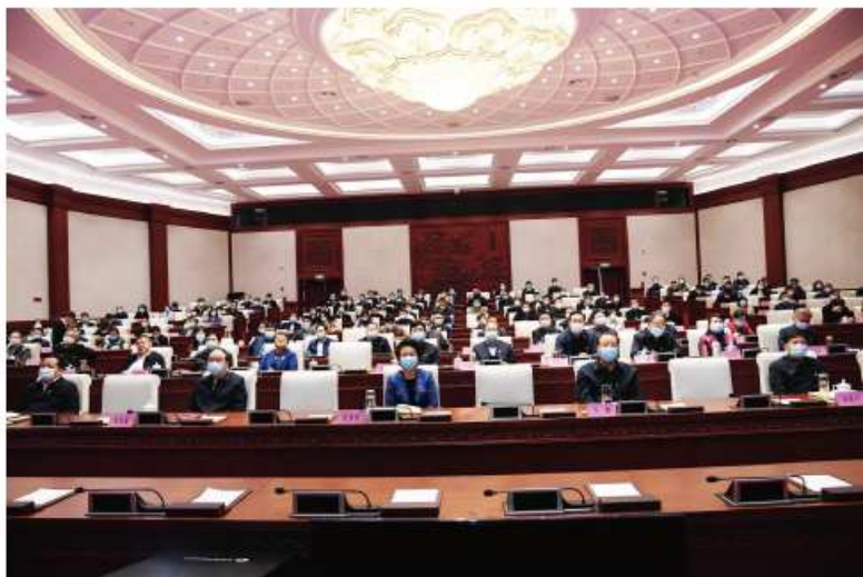
河南省人大常委会机关举行党史学习教育专题讲座

学习领会习近平总书记关于党史的重要论述，紧紧围绕学懂、弄通、做实党的创新理论，做到学史明理、学史增信、学史崇德、学史力行；要立足人大工作实际，坚持守正创新，发扬优良学风，明确学习要求、学习任务，高标准、高质量地完成学习教育各项任务；要树立正确党史观，准确把握党的历史发展的主题主线、主流本质，正确认识和科学评价党史上的重大事件、重要会议、重要人物；要把学习党史和做好人大重点工作结合起来，把学习成效转化为工作动力和成效，积极主动作为，依法履行职责，奋力开创新时代人大工作新局面。