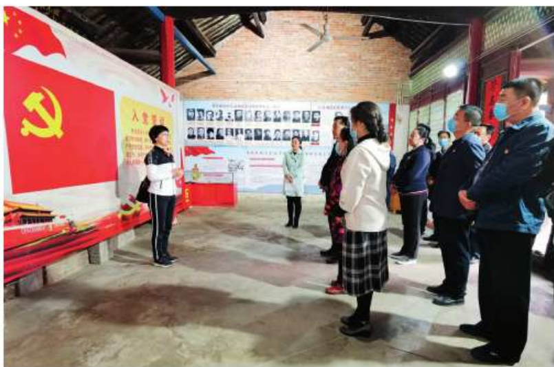
洛阳市人大常委会机关组织开展党员主题日活动

梁村距洛阳城区约13公里，北有伊河阻隔，南有龙门山、万安山为屏障，位置相对偏僻。据解说员介绍，这个地理位置偏僻、群众基础好、地下党员多的小村庄，早在1937年就成为中国共产党指挥豫西地区群众开展革