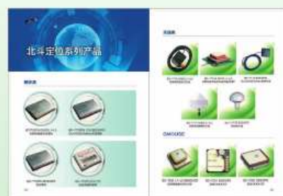
北斗定位系列产品，授时产品 精度5纳秒，世界领先