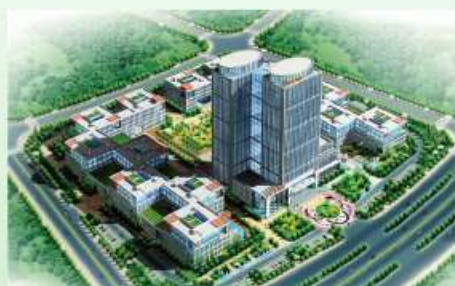
威科姆科技产业园区鸟瞰图