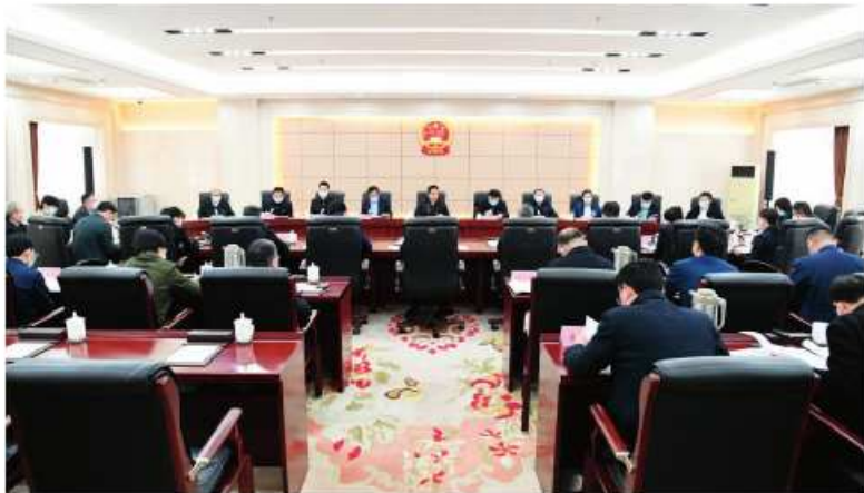
河南省人大常委会机关党组理论学习中心组围绕党史学习教育进行专题研讨

要持续抓好结合转化，不断提高机关工作水平。学党史、悟思想、办实事、开新局，是这次党史学习教育的目标要求。要把学习教育作为加强和改进人大工作和建设的契机，同贯彻落实中央、省委重大决策部署结合起来，同高质量开展省人大常委会和机关的各项工作结合起来，做到两手抓、两促进，以实实在在的工作成效体现党史教育的成果。要守正创新做好人大各项工作。当前，人大工作正面临一些新的形势和任务。能不能担负起时代赋予的重任，对我们是一种考验，也是对党史学习教育成效的最好检验。在刚刚闭幕的全国人代会上，栗战书委员长强调，