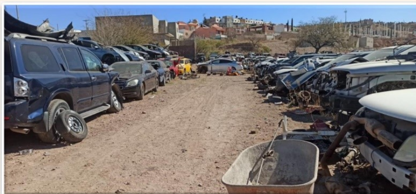
Un establecimiento de vehículos chatarra en Nogales, Sonora.

El gobierno de Baja California realiza esfuerzos para minimizar los efectos adversos del manejo de las llantas de desecho que se generan en Baja California. El gobierno federal, a través de la Secretaría de Economía, autoriza la importación de 800,000 llantas usadas de los Estados Unidos a Baja California cada año. En 2020, debido al efecto de la pandemia de COVID-19, no se alcanzó a importar toda la cuota; sin embargo, la proliferación de llantas que no se manejan adecuadamente es evidente. Se estima que por cada llanta importada legalmente, puede ingresar otra de manera informal o ilegal. En los últimos años sólo dos empresas han sido autorizadas para el manejo adecuado de llantas: Cemex en Ensenada y Geocycle e Mexicali. La mayor incertidumbre radica en la falta de financiación para la infraestructura de manejo y proceso de llantas.