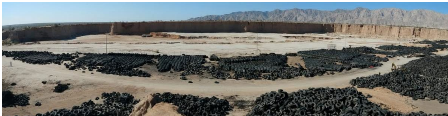
Llantas de desecho

El gobierno de Baja California realiza esfuerzos para minimizar los efectos adversos del manejo de las llantas de desecho que se generan en Baja California. El gobierno federal, a través de la Secretaría de Economía, autoriza la importación de 800,000 llantas usadas de los Estados Unidos a Baja California cada año. En 2020, debido al efecto de la pandemia de COVID-19, no se alcanzó a importar toda la cuota; sin embargo, la proliferación de llantas que no se manejan adecuadamente es evidente. Se estima que por cada llanta importada legalmente, puede ingresar otra de manera informal o ilegal. En los últimos años sólo dos empresas han sido autorizadas para el manejo adecuado de llantas: Cemex en Ensenada y Geocycle e Mexicali. La mayor incertidumbre radica en la falta de financiación para la infraestructura de manejo y proceso de llantas.