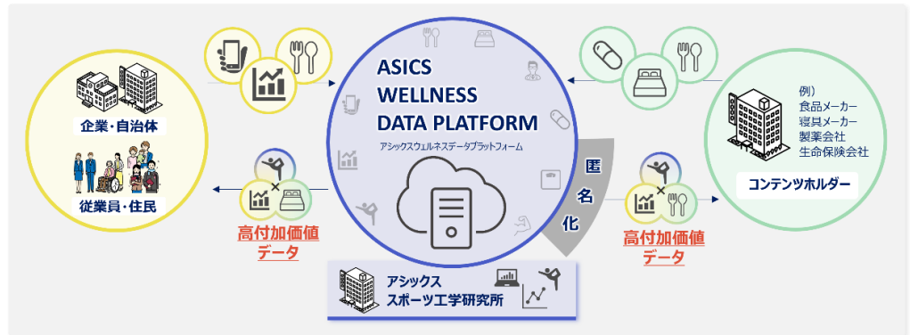
AWDPで得られた高付加価値データを活用した「データ分析事業」のイメージ

現在、いくつかの企業や自治体に向けて、本プラットフォームを活用した具体的な健康増進施策の提供を開始しています。今後はアシックススポーツ工学研究所と連携し、AHCC事業のデータのほか、健康診断の結果や睡眠、食事などの外部データを掛けあわせることでより具体的なソリューションを提案するなど、さらなるパーソナライズ化を推進します。また、AWDPで得られた高付加価値データを活用した「データ分析事業」など新たなデータビジネスの可能性を探りながら、さまざまな企業との連携もはかっていきます。