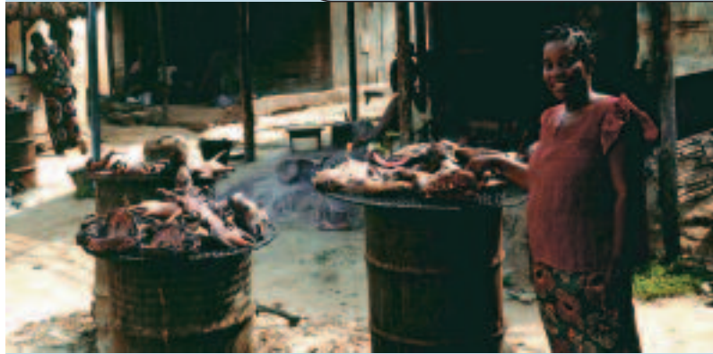
Vente de venaison au village. Selling bushmeat in a village.

Des acteurs « non identifiés » opèrent également dans l'approvisionnement urbain ; on estime en effet (BAHUCHET, IOVÉVA, 1999 ; DIÉVAL, 2000 ; STEEL, 1994) que 30 à 50 % du ravitaillement urbain en venaison ne transite pas par les places de marché. Une hypothèse souvent avancée s'appuie sur les liens étroits entre les élites installées en ville et les parents du village. Des flux importants de viande seraient organisés en fonction de commandes des élites qui en assureraient directement le transport, puis la vente en ville, selon des circuits hors marché.