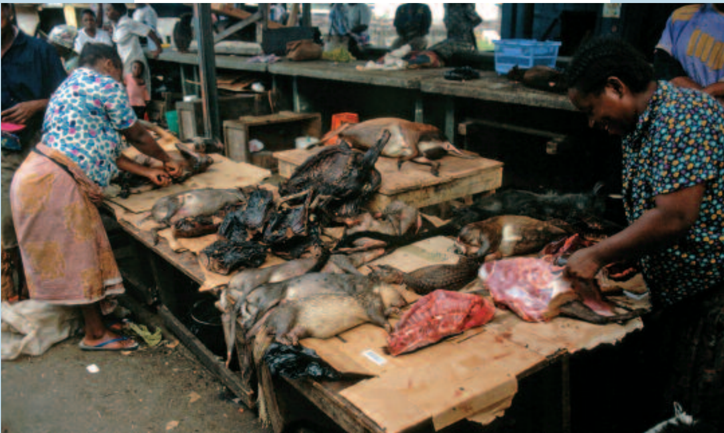
Vente de gibier à Libreville (Gabon). Selling game in Libreville (Gabon).

Le thème de la chasse commerciale en Afrique centrale est décliné en deux articles : I. La venaison ou le négoce d'un produit vivrier ; II. Une activité territoriale de rente. Le présent article analyse la filière commerciale – évolution, organisation, structuration socio-économique –, tandis que le second abordera le volet production, avec les aspects sociaux et techniques.