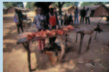
Marché villageois à Gouzé (République centrafricaine). Vente de viande d'élevage et de venaison.

A bushmeat market in Libreville (Gabon). Giant pangolin, brush-tailed porcupine and great cane rat.