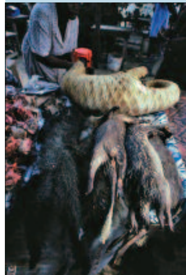
Marché de venaison à Libreville (Gabon). Pangolin géant, athérure et aulacode.