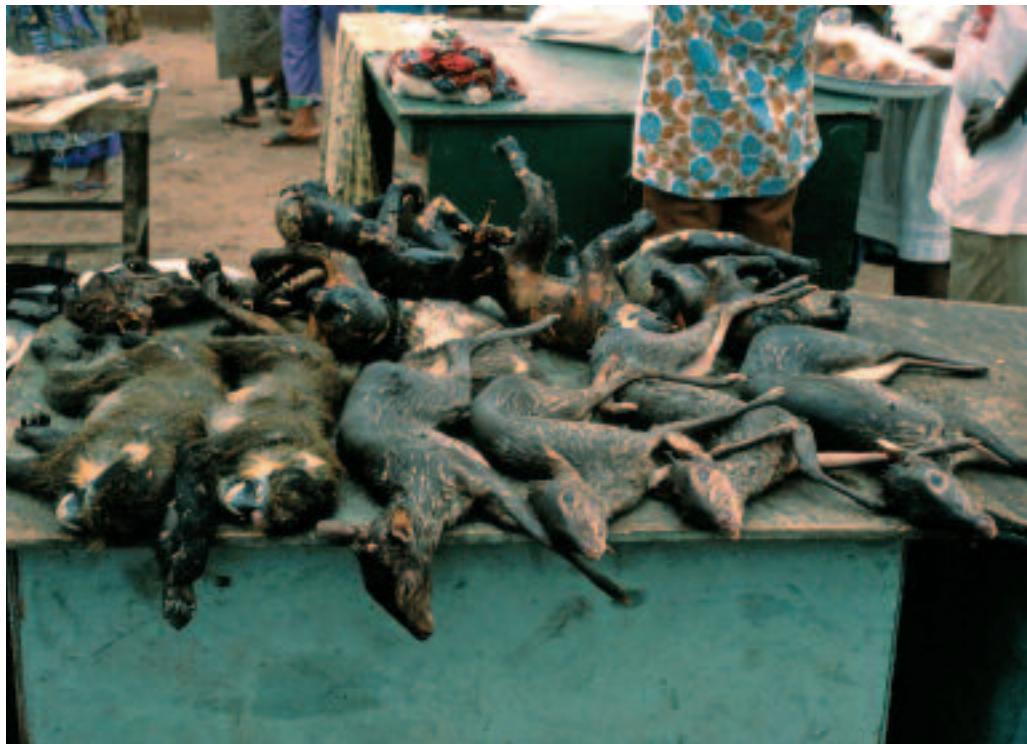
Vente de venaison fraîche à Libreville (Gabon). Selling fresh bushmeat in Libreville (Gabon).

Ces méthodes supposent cependant l'établissement d'une relation personnelle forte entre les partenaires. Le collecteur est ainsi appelé à constituer un territoire d'intervention sur lequel, si possible, il cherchera à s'assurer un monopsonne.