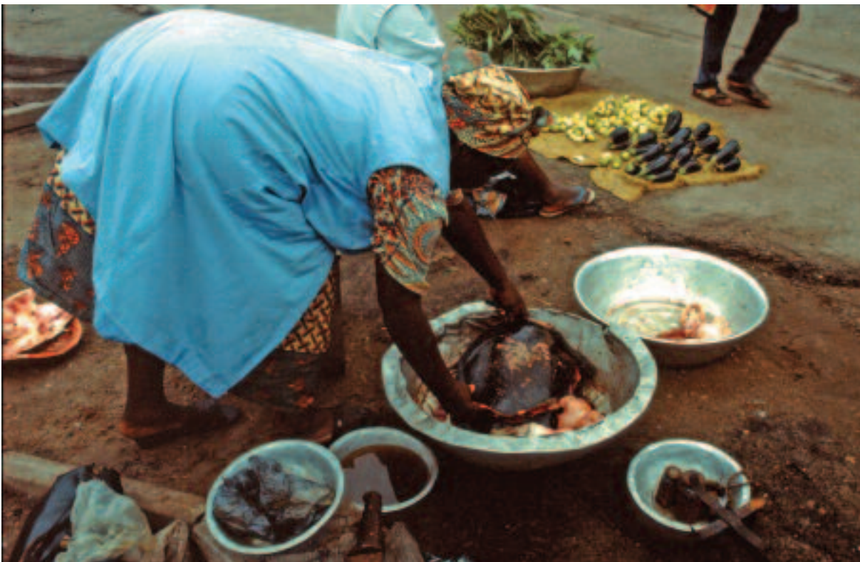
La vente de venaison, une activité féminine (Libreville, Gabon). The bushmeat trade is handled by women (Libreville, Gabon).

nales et très actifs auprès des bailleurs de fonds, considèrent la faune sauvage comme un gisement essentiel de biodiversité ; elle doit être protégée, ou éventuellement gérée à travers le tourisme de vision ou la chasse sportive, en vue d'un profit économique garantissant sa pérennité. Pour l'immense majorité des populations africaines, au contraire, la faune sauvage est d'abord une source de nourriture ; ainsi, traditionnellement, en Afrique centrale, le même terme nyama désigne l'animal sauvage et la viande dans les langues bantu. Avec la modernisation et la monétarisation de l'économie, l'activité masculine première, la fourniture de protéines animales à la communauté villageoise par la chasse, a évolué vers des prélèvements commerciaux, en direction des marchés urbains. Il est nécessaire de bien garder à l'esprit cette opposition des représentations pour analyser sereinement la réalité des activités cynégétiques en Afrique.