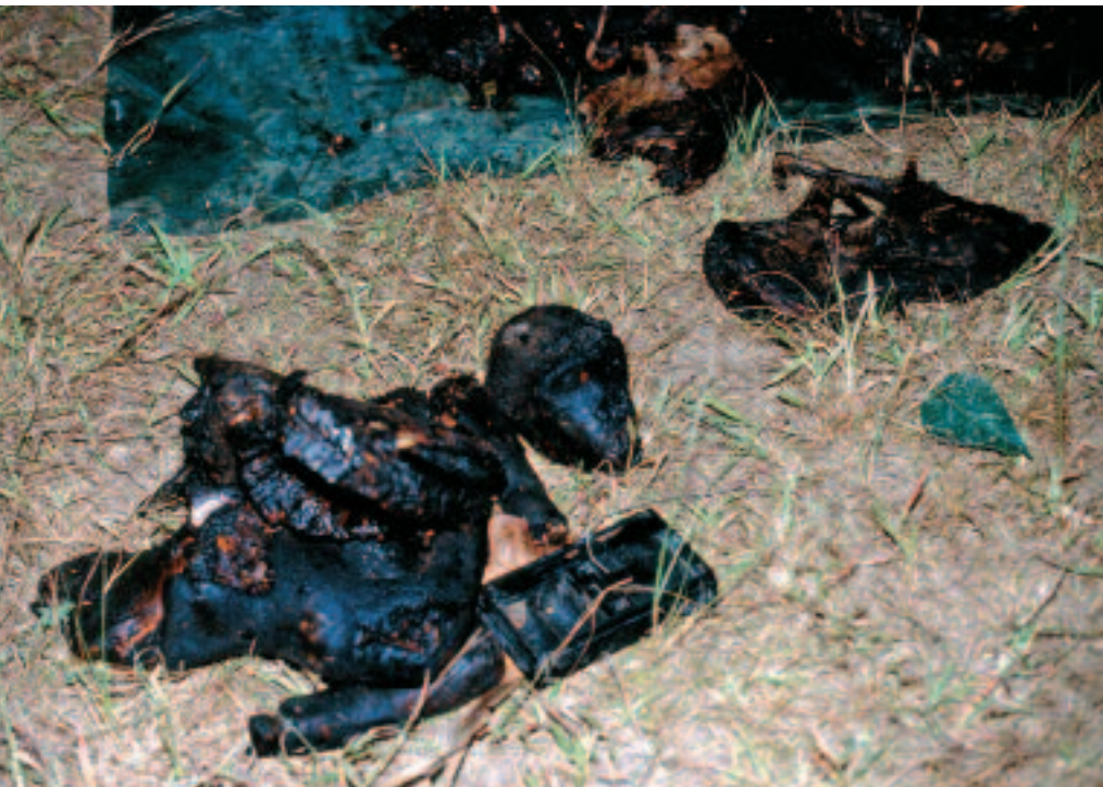
Viande de gorille boucanée saisie sur le marché de Libreville (Gabon). Smoked gorilla meat impounded on the Libreville market (Gabon).