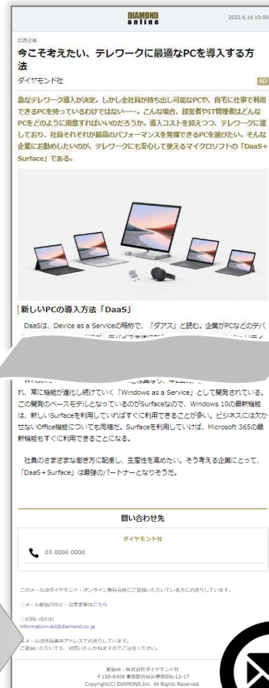
HTMLターゲティングメール型タイアップ