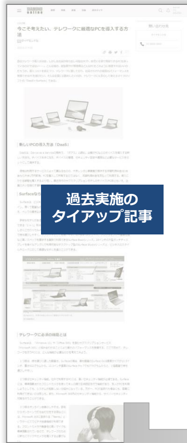
過去実施タイアップ記事

過去掲載したタイアップ記事をHTMLメールに転載して配信。 メールは会員属性を指定したターゲティングメールとして配信が可能です。期間限定の配信通数増量にてご提供します。