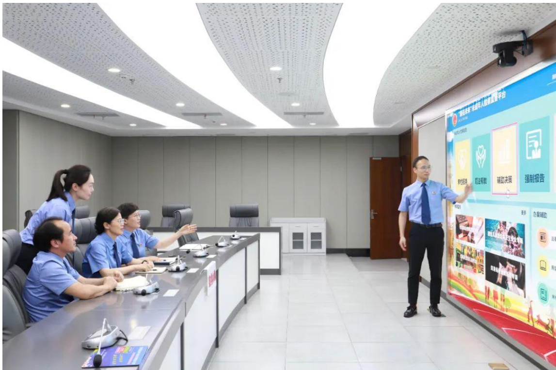
无锡市惠山区检察院检察官运用“惠佑未来”未成年人检察监督平台辅助办案。

数字检察是推进未成年人检察工作现代化的重要引擎，也是“高质效办好每一个案件”的重要手段。为助推未成年人保护领域社会治理体系和治理能力现代化，近年来，江苏省无锡市惠山区检察院在数字检察工作模式指引下，围绕保护未成年人健康成长，构建“惠佑未来”未成年人检察监督平台，在运用数字化和大数据技术助力未成年人综合司法保护方面探索出一条基层实践之路。