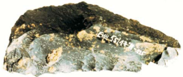
Abb. 3: ca. 100.000 Jahre altes Werkzeug des Neanderthalers: Schaber (Größe 2 x 5 cm)