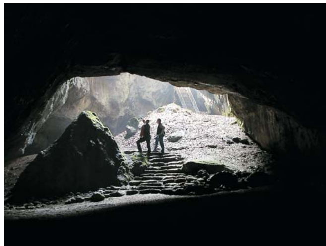
Abb. 1: Einhornhöhle - Die "Blaue Grotte"

Neben den Einhorngräbern wurde die Höhle aber bereits seit geraumer Zeit von Geowissenschaftlern und Forschern aufgesucht, so bereits von den Universalgelehrten Leibniz (1686) und Goethe (1784). Ende des 19. Jahrhunderts hat der Berliner Arzt und Anatom Rudolf Virchow hier gegraben, Hermann Löns suchte die Höhle ebenfalls auf. Die Forschungen um die letzte Jahrhundertwende hatten vor allem das Ziel, den „diluvialen Menschen“ (= Mensch des Eiszeitalters) zu finden. Dies gelang erst 1985 mit dem Fund von Steinwerkzeugen aus der Altsteinzeit. Die Ausgrabungen 1985-88 ergaben, daß die Höhle vor etwa 100.000 Jahren über lange Zeiträume von den Neandertalern besiedelt war. Zudem bietet die Einhornhöhle innerhalb des niedersächsischen Raumes die bislang einmalige Gelegenheit, anhand einer Höhlenfauna vielseitige Auskunft über die hiesige tierische Lebewelt während eines größeren Zeitraumes innerhalb des jüngeren Eiszeitalters bis zur Jetztzeit zu erhalten. Bei den Grabungen wurden bislang Knochenreste von über 70 Wirbeltierarten gefunden. Neben den großen