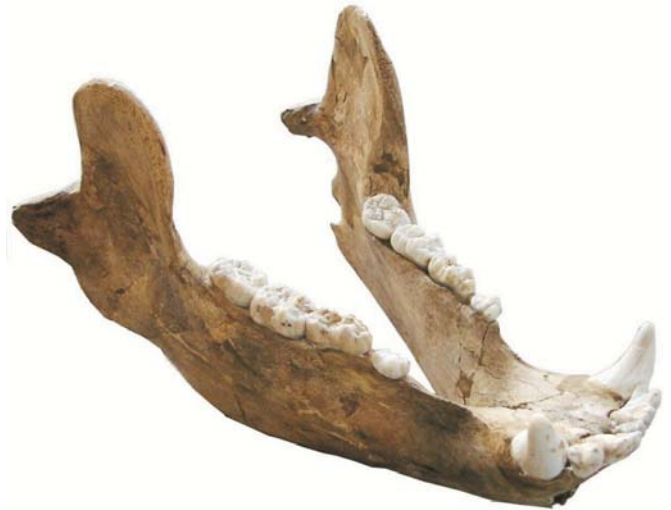
Abb. 2: Vollständiger Unterkiefer eines Höhlenbären (ca. 30.000 Jahre alt, Länge ca. 30 cm)

Verantwortlich: LBEG: Dr. Heinz-Gerd Röhling