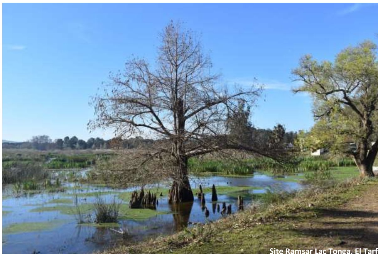
Site Ramsar Lac Tonga, El Tarf