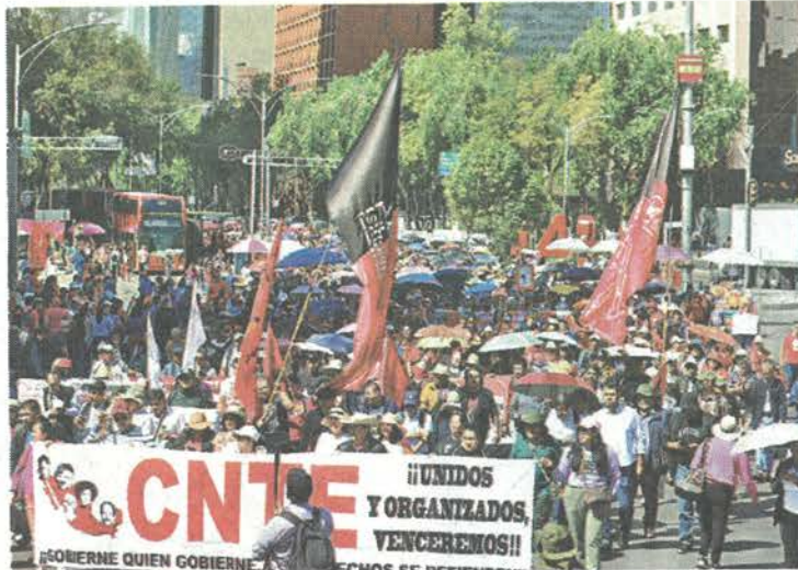
Unos mil 200 trabajadores marcharon sobre Reforma. J. CARBALLO

“Ellos están en su derecho (de protestar), pero no hay ninguna necesidad, se van a reunir con la secretaria de Gobernación y, si es necesario, yo me reúno con