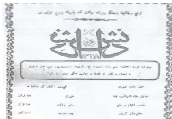
شکل ۴) سرصفحه نشریه دانش