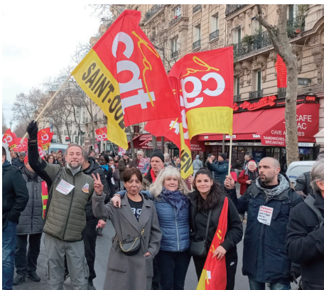
年金改革に反対するフランスのデモ (2023年2月)