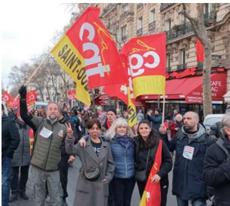
年金改革に反対するフランスのデモ (2023年2月)