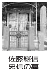
佐藤継信 忠信の墓

飯塚(飯坂)で、芭蕉は佐藤庄司の旧跡を訪ねる。子の継信と忠信は源義経に従って戦に参加し、継信は八島の合戦で義経をかばって命を落とし、忠信は頼朝から追われる義経を守って吉野で戦死する。「平家物語」で知られた話だ。