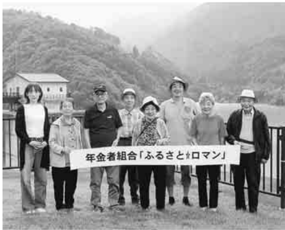
細木ダム前で米沢支部

支部主催の「ふるさとロマン」は9月30日8人で市内の名所を巡りました。186年前の即身仏明海上人御堂や開運・招福の甲子大黒天本山宝珠寺。17年前完成の細木川ダムを眺め、涼風を受けながらのお弁当。「夏のあいだはロマンは休みだ