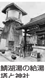
湯給湖鱒 塔と神社

源泉が51度の熱さで知られる飯坂温泉の共同浴場「鱒湖湯」に行った。縁台で休む老女に、熱くないか尋ねると、「何かかけ湯をすれば慣れるから。心配はいらないよ」と、張りのある声。湯上りで風にあたる艶姿、若いころの美女ぶりが想像できる。