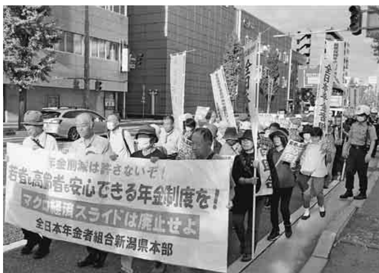
元気にデモする新潟一揆

中央本部の支給日宣伝は15日JR大塚駅前(写真上)で要求と総選挙を主題に宣伝。堂々とマイクを使った楽しい要求選挙を行いました。