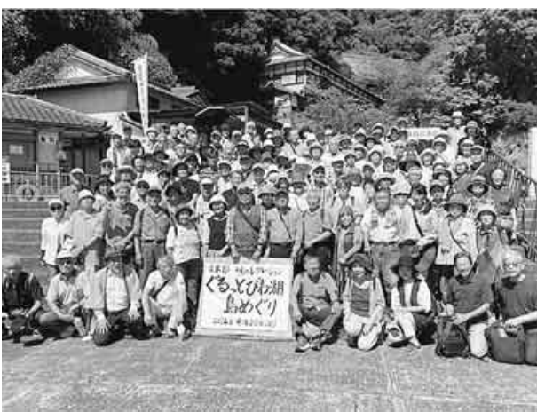
びわ湖島めぐり参加のみなさん

着。竹生島では、参加者全員が一堂に会して集合写真を撮影し、自由行動となり、それぞれ、拝観する人、暑くて途中で帰ってくる人、茶店でソフトクリームやかき水で休憩の人、それぞれ楽しみました。