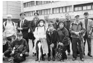
悔いのない運動を

政府の言いなりで いいの、違憲立 法審査権の行使を やかに審理を」と訴えま した。愛知弁護団の林弁 護士は若い書記官に「あ なた方は政府の言いなり でいいのですか」と話を したことを明かしまし た。