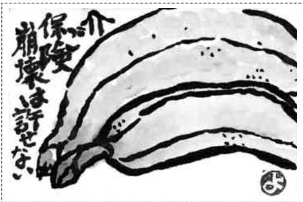
愛知・豊田市 宮島 芳枝