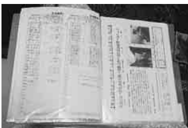
56回のウォーキング記録の資料集

5月の支部サークルの活動予定は、1日はメーデー、8日パークゴルフ、9日ちくちく(着物リメイク)、11日健康マージャン