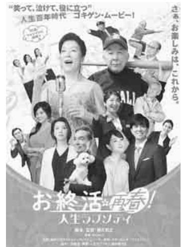
青春の夢を、と力づけられる

もちらほら。前日の雨で開催が危ぶまれましたが、天気も回復し、笑顔の花があちこちで咲き交流を深める集いとなりました。