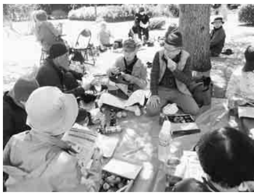
サークル活動の紹介やグループ交流も

松山支部は「文化・レク・サークル活動でいきいきと仲間とつながろう」「高齢者を一人ぼっちにさせない」を目標に活動しています。