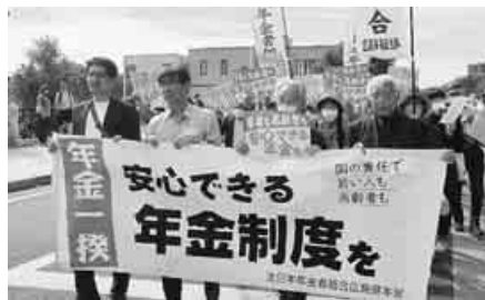
若者5人も参加したデモ

10月13日広島市でも年金一揆を行いました。原爆ドーム前で集会を開き、本通り商店街(広島市で一番の繁華街)を45人がデモ行進しました。(県本部・利元克己)