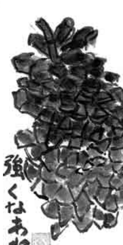
兵庫・明石市 田岡 いく代