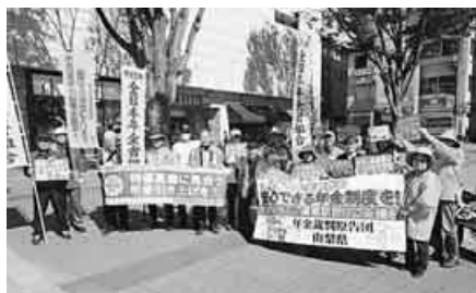
他団体代表を含め22人が参加

山梨県本部は、10月13日12時30分から13時まで甲府駅南口広場で2023年金一揆&フェスタin