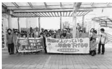
声をからして訴えました

山田県本部委員長が「物価高騰に見合った年金引き上げを切実な思いで要求しています」と主催者あいさつ。参加団体の