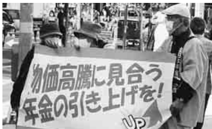
道外からの観光客も署名

雪の便りも聞こえ始めた10月13日、道内30カ所で年金支給日宣伝に取り組みました。札幌市内は8つの区と道本部主催の9カ所で行いました。宣伝行動には242人が参加、年金・健康保険証などの署名553筆が集まり、2500枚のチラシを配布しました。