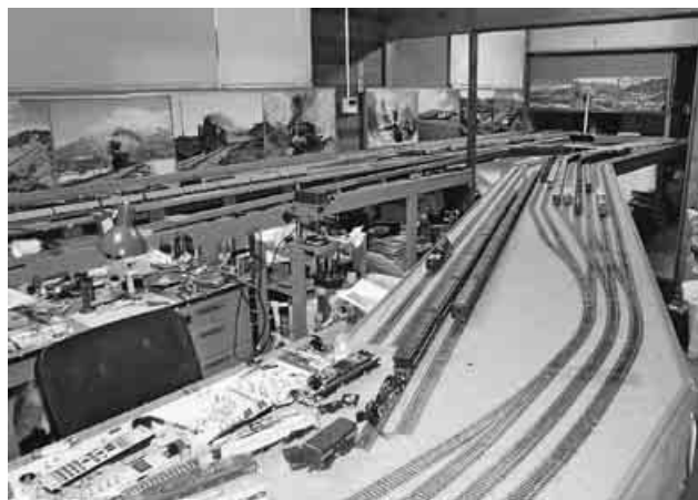
(上) 自宅の2階18畳分の部屋で (左) 毎日、様々な加工を楽しむ