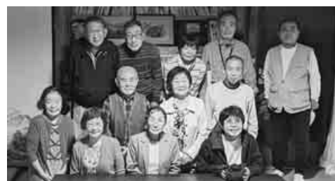
12人で蕎麦懐石に舌鼓

蕎麦がき、炊き込みご飯、ざる蕎麦のフルコース。何度食べてもおいしいものばかりです。食後のおしゃべりも楽しく、年金問題や平和の話などをして盛り上がりました。活動3分・楽しみ7分を地でいく支部活動の実践です。(馬場隆雄)