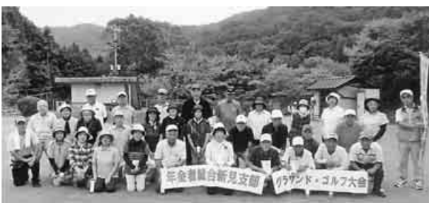
秋空の下35人が参加

9月27日、新見支部主催の第20回ゴルフ大会が新見市の哲多みどりの広場グラウンドゴルフ場で開かれました。年金者組合員以外の参加もあり、35人が秋空に快音を響かせました。