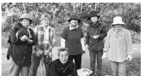
たくさん拾ってニコニコ