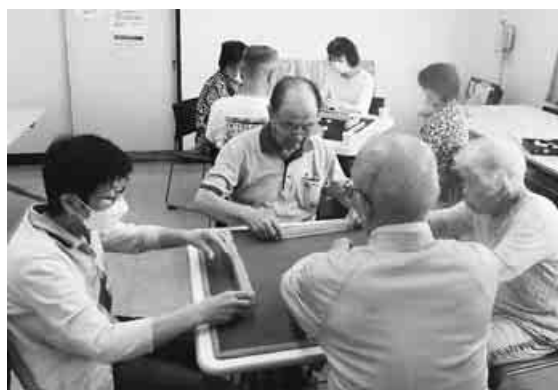
楽しく時間を忘れるほど

回も盛況で、楽しく時間を忘れるほどでした。麻雀は認知症予防にも効果があるといわれています。初心者も大歓迎です。