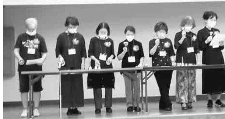
第19回道本部女性部交流の旅 会えてうれしい定山溪