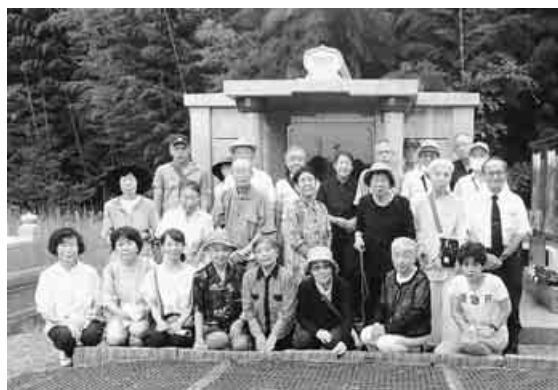
納骨、献花おわって墓所前で集合写真

東京・足立支部は、17年前に建立した共同墓所「足立年金者の礎(いしじ)」の合同慰霊祭を9月20日に開催しました。場所は、茨城県つくば市内の神宮寺境内で、バスもコロナ対策をして運行しました。現地集合も含めて