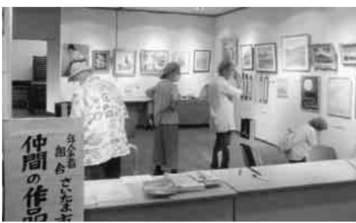
一般の人々も多く訪れて

コロナ禍や会場の都合などで開催が延びていたさいたま市支部協議会主催の「文化祭」作品展が、