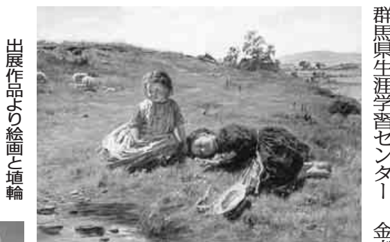
展覧作品よりの絵画と埴輪

「す」が上手く言えないからこうなっただけと、まったく気にしていない。私はこの名前は世界で