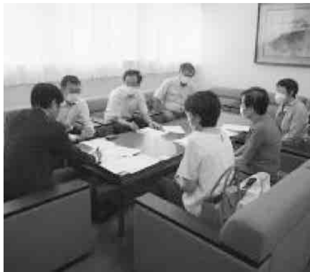
富山県議会自民党へ要請

9月11日、①加齢性難聴者の補聴器購入に対する公的補助制度創設、②・援助することを求めました。 9月11日、①加齢性難聴者の補聴器購入に対する公的補助制度創設、②・援助することを求めました。