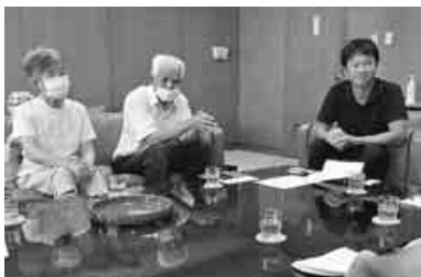
支部5役で松山市議と懇談

愛媛・松山支部は補聴器公的助成を求め、市議会議員に紹介しました。 愛媛・松山支部は補聴器公的助成を求め、市議会議員に紹介しました。