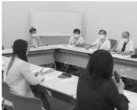
厚労省と交渉する中央本部

今年度から自転車利用時のヘルメット着用が努力義務となりました。これをうけて、ヘルメット購入費用を助成する自治体があります。 今年度から自転車利用時のヘルメット着用が努力義務となりました。これをうけて、ヘルメット購入費用を助成する自治体があります。