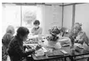
美術クラブのデッサン風景