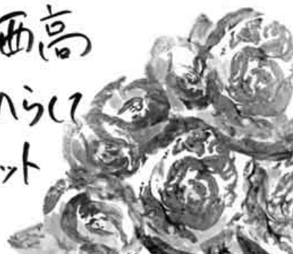
大阪市 松本 誠造