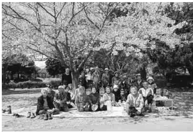
雲一つない空の下、花びらに埋もれながら