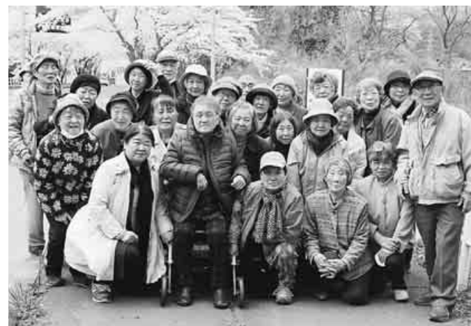
帰りのバスは元気にうたごえ

ゴザの上では女性部による野立てが行われ抹茶とお菓子をごちそうに。昼は田陣を組み花見弁当を食べながら積もる話に花を咲かせました。(山中 稔)