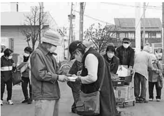
25筆の署名が集まった

年金者組合青森三八支部は、4月14日、年金支給日行動を強風下、午前11時からコープ店前で