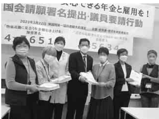
署名を国会議員へ手渡す

年金者組合は全労連と7651人分を提出し、ともに3月22日、「若者も高齢者も安心できる年金と雇用を」請願署名8万5634人分、「物価高騰に見合う年金額引き上げを」の陳情署名4万