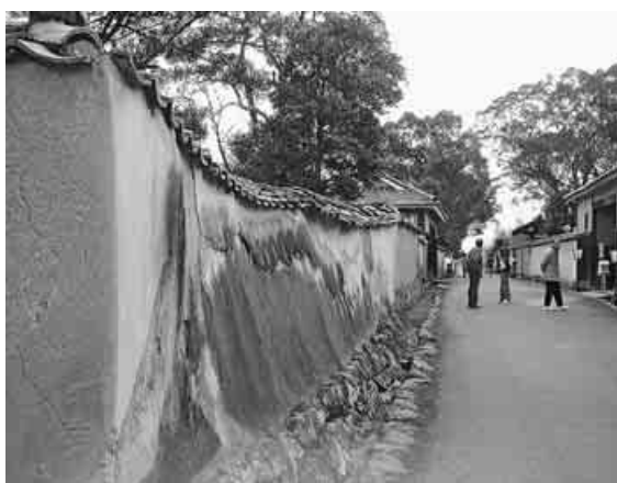
土塀が残る北台武家屋敷通り

その⑬ 坂を下りて行った。酔屋の坂、志保屋の坂など商家の名が付いた坂や、馬や籠かきの歩幅に合わせた勘定場の坂などいく