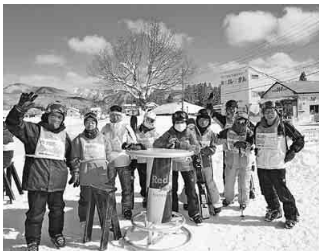
恒例の年金者スキー交流会、お揃いのゼッケンで