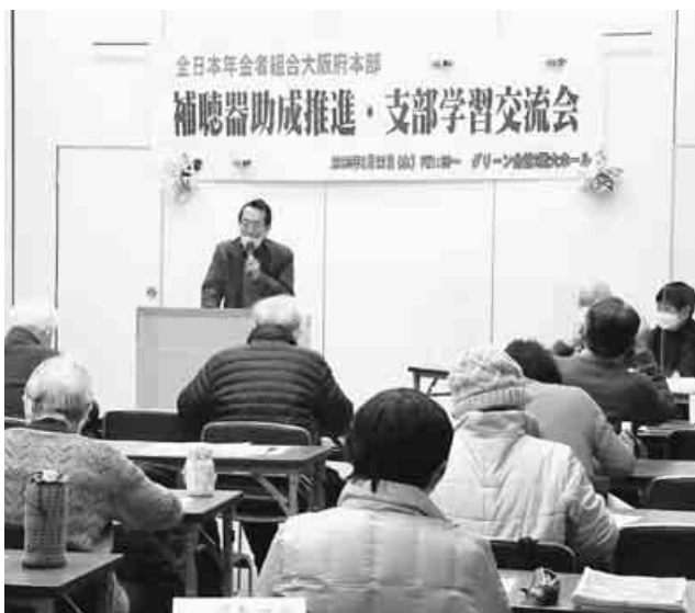
大阪府本部の補聴器助成推進学習会

補聴器助成運動の推進めざして、大阪年金者組合は2月22日、「補聴器助成推進支部学習交流会」を大阪グリーン会館2階ホールで開催、48人が参加しました。