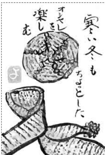
北海道・北見市 高橋 陽子