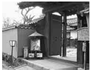
武家屋敷が茶屋に

には、南台武家屋敷と北台武家屋敷が建ち並ぶ。武家屋敷は高台に、商家はその狭間、これは差別ではなく区別だと土地の人が話していた。そしてこの形状を「サンドイッチ型城下町」と呼ぶらしい。わかりやす