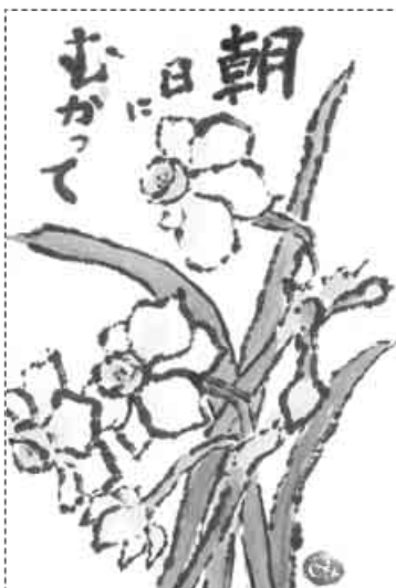
神奈川県・相模原市 菅沼 美保子