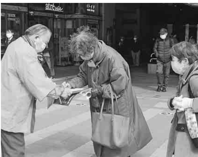
年金上げの願いをこめて署名 (大塚)