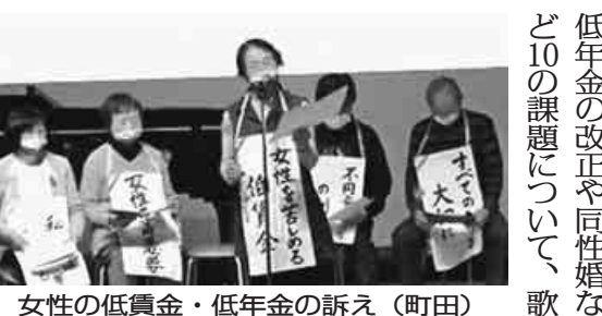
女性の低賃金・低年金の訴え(町田)