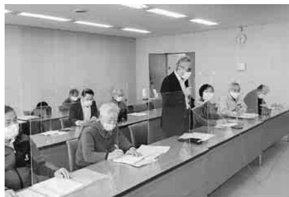
山口県と交渉する山口県本部

山口県本部は、昨年11月県知事に要請書を送り、2月2日、2年ぶりに交渉を行いました。年金については①最低保障年金制度を早急に創設することを国へ要請する。②「マクロ経済スライド」廃止を国へ要請する。③低年金で生活が困難な国民負担増となる制度改定でサービス低下改悪は行わないよう、国に求めること。また高齢難聴の補聴器購入助成制度を県として創設すること。運動の前の読み合わせ。すべての人間は、生まれながらにして自由であり、かつ、尊厳と権利について平等です。