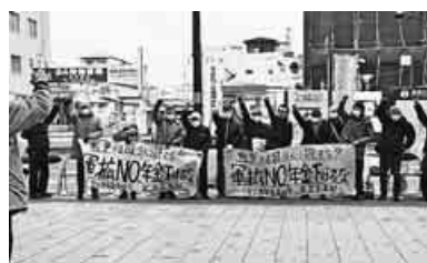
年金一揆に参加した組合員＝奈良