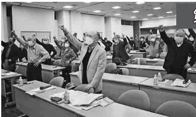
「ガンバロー」を三唱する中央委員ら