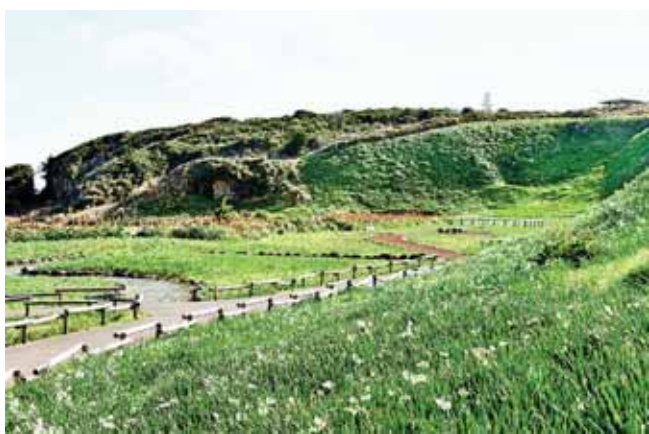
野スイセンが群生

アロエは、明治後半に地元の漁師が、南の島から持ち帰ったのが始まりと定まりました。