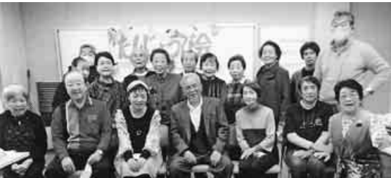
誕生日を笑顔でお祝い

埼玉・川口支部は昨年11月30日に並木公民館でお誕生日会を開きました。19人が参加して楽しい時間を過ごしました。