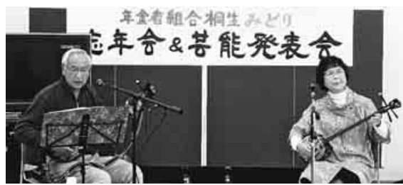
三線を弾きながら掛け合いで歌う2人