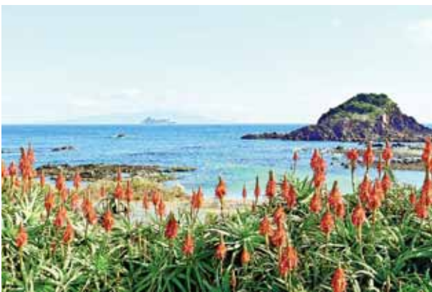
とんがり帽子のアロエの花

夏は海水浴で賑わい、秋には西洋ススキが野を彩る爪木崎。カシイチゴ、イブアサツキ、ハマカンゾウ、イソギクなどの海浜植物も咲きます。伊豆急行線は車窓からの眺めがいいので、各駅停車に乗ったらキンメ電車。伊豆七島が見える場所では車掌が鳥々を紹介してくれました。