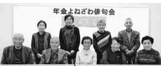
俳句を愛する俳句会の仲間たち。新しい年に期待する声も

昨年12月8日、10人の参加で年金よねざわ俳句会の忘年会を開催しました。持参の飲み物で乾杯し、お弁当を食べ、思い出話はずみみしました。 「7月に入会したがコロナ禍で集まっていたの句会がなく、10月にやっとお