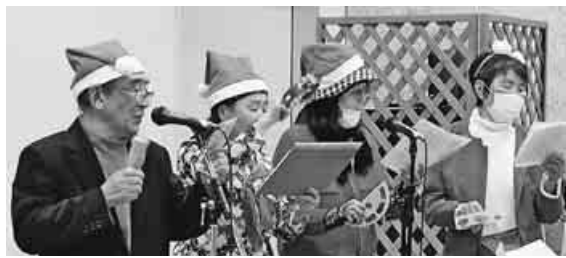
女声が美しく響いた有志のうたごえ

コロナ禍で2年間中止だった忘年会&芸能発表会を開催。「楽しかった」「芸達者にびっくりに」と喜びの声が集まりました。オープニングはオカリナサークルによる演奏で、最後はみんなで「故郷」を歌いました。