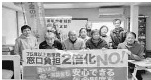
輪島・能登支部結成大会

11月27日、全日本年金者組合輪島・能登支部結成大会が12人の出席で開催され、本ページ掲載記事