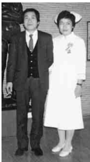
卒業式には会社を休んで出席してくれた夫と