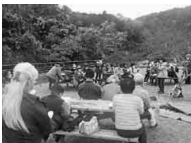
自然の中で食べて歌って

34人が参加して一緒に食事をし、自己紹介をしました。またみんなで「もみじ二故郷」を大合唱しました。新しい組合