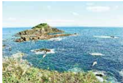
伊豆大島も見える

スイセンとアロエの花が咲く伊豆下田の爪木崎。訪れた日は、白いスイセンは咲き始めて、赤いアロエの花はまだ見ごろでした。