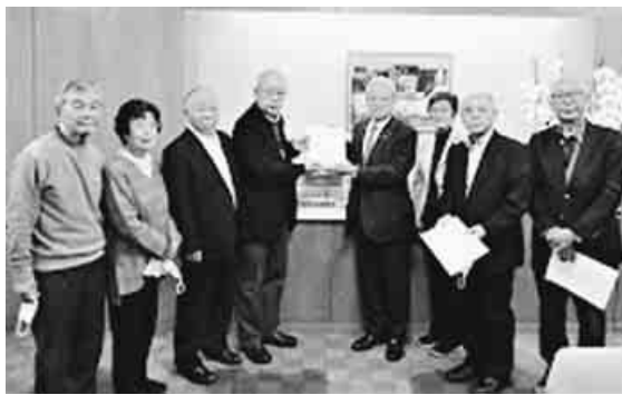
羽生田副大臣に要請書を手渡す本部三役

年金者組合は12月5日、2023年度の予算編成にあたり、中央本部3役が公的年金の「物価上昇率に基づく増額改定」、75歳以上の窓口負担2倍化の撤回、介護 保険の見直し、病院と保健所の削減・統廃合の中止等を求め、羽生田俊厚生労働副大臣に申し入れを行いました。杉澤委員長が「申し入れ書」を手渡すとともに、岸田首相への陳情署名14,505筆(合計29,661筆)を副大臣に手渡し、「物価高騰のもとで年金は引き下げられ10月からは高齢者医療費の窓口負担が2倍化された。相次ぐ物