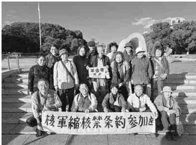
広島平和公園では横断幕を広げて

広島へ2泊3日... 10月30日から2泊3日、広島、宮島、岩国へ18人でバス旅行。広島平和公園慰霊碑に黙祷し、「政府は核兵器禁止条約を批准せよ」と横断幕を持って資料館まで歩きました。