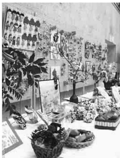
見事な作品に感嘆の声が

10月29日と30日の両日、群馬県館林市文化会館を会場に第24回館林邑楽支部文化祭を開催しま