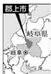
○郡上八幡観光協会(旧庁舎記念館内) TEL0575・67・0002