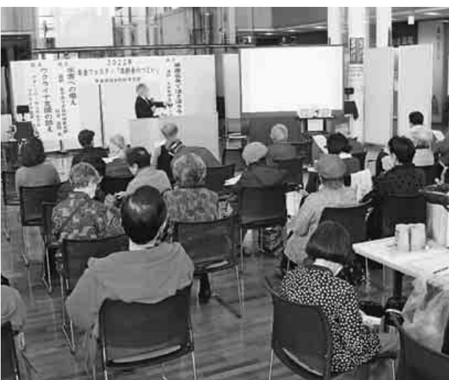
3日間ひらかれた秋田市支部のフェスタ

島根日日新聞は「バブル崩壊以降の日本経済に低迷は将来への生活不安が根っこにある。はつきり言えば、老後の生活不安であり、それが消費を抑制し、投資を含めた経済成長の芽を摘んでい