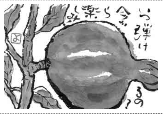
愛知・名古屋市 山盛 葉子