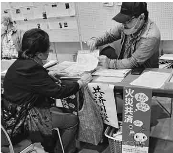
栃木はフェスタで全労連共済コーナーを設置、加入をふやしました