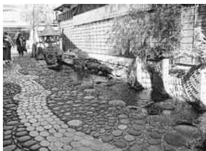
▲湧水の流れる「やなかのこみち」