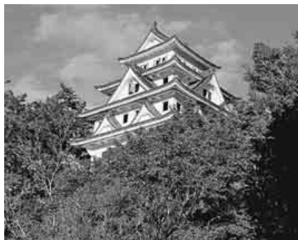
紅葉に包まれる天守閣(吉田川の両岸に広がる八幡町)

純白の天守閣が真っ赤な紅葉に囲まれて青空にそびえている。ギンギン床音を立てながら天守閣にのぼる。周辺の山々が一望でき、吉田川の両岸に2階建ての家屋がぎっしり並んでいる。