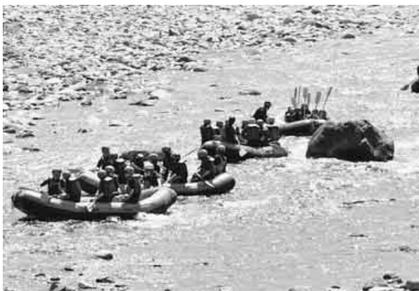
ラフティングを楽しむ子どもたち