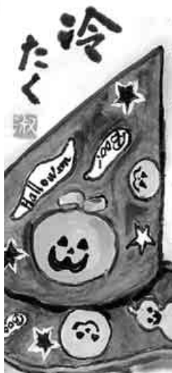
福岡・水巻町 江上 淑子