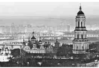
美しい首都キョウの夕暮れ

メール、FAX、ハガキでお送りください。10月25日締め切り。中央本部「年金者しんぶん」編集部まで。