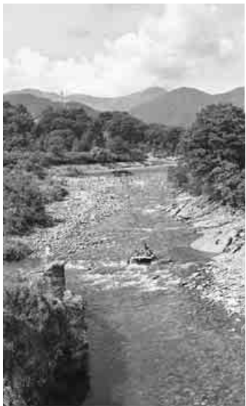
渓谷が美しい諏訪峡

たのは小学6年生で、東京からの修学旅行。偶然、ガイド付きなので初心者でも安全とのこと。挑