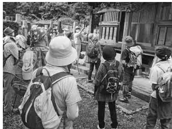
安馬谷里山の伝説や歴史を学びながら

に取、いよいよ山道へ。沢沿いの泥の道です。伊豆ガ岳から正丸峠に向かう尾根にある五輪山の手前が急斜面で丸峠に着きました。