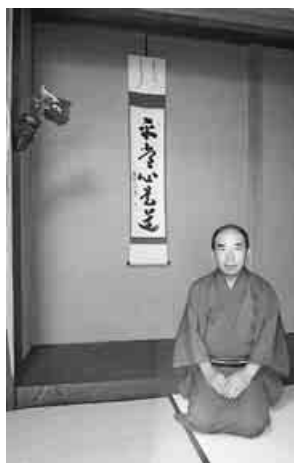
表千家の茶の湯をたしなむ大内さん、稽古仲間にも年金者組合加入を勧めています

年金者組合に入ったけれど、「何をすれば…」の状況にいた頃、ブロック集会で労働共済の火災共済を知ったことです。「これなら私にもできる」と思ったことが共済推進活動の始まりです。私の父は、農協の職員をしながら農業、私は労働金庫職員、どちらも助