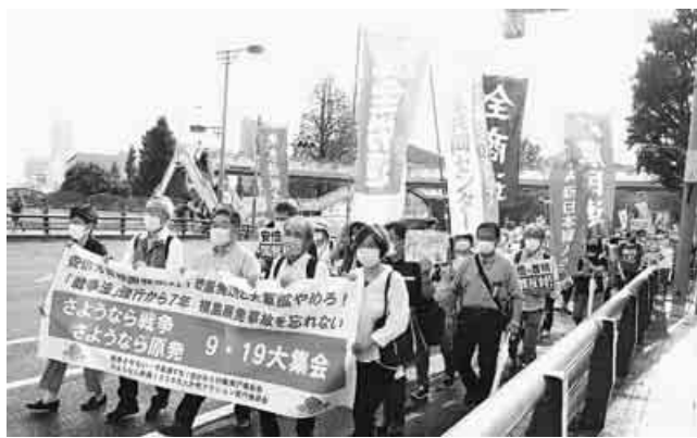
代々木公園での大集会後のデモ行進(9月19日)