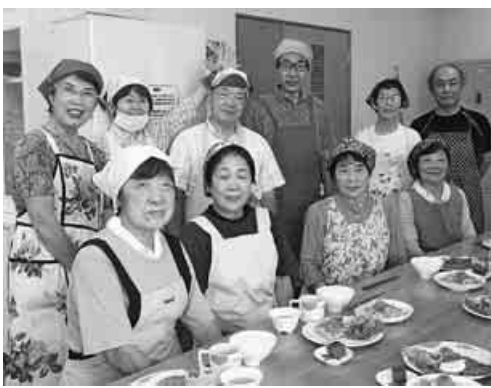
「板さん」の仲間たち

豚カツもジュシーでおいしいのですが、このミラノ風カツレツは香ばしくて大変美味しかったです。