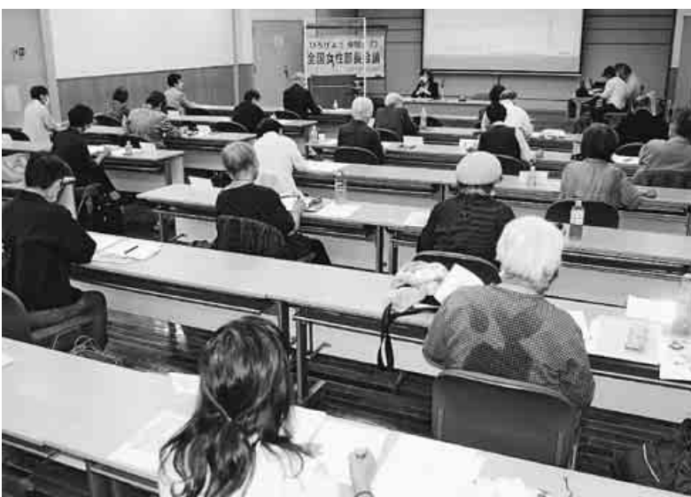
第7回全国女性部長会議

「日本の社会・経済構造が低年金の女性を生み出した。非正規雇用で働く人たちは低年金者予備軍。年金者と働くものがしっかり手を結んで安心して暮らせる年金制度を実現し