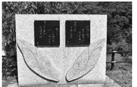
与謝野晶子の歌碑