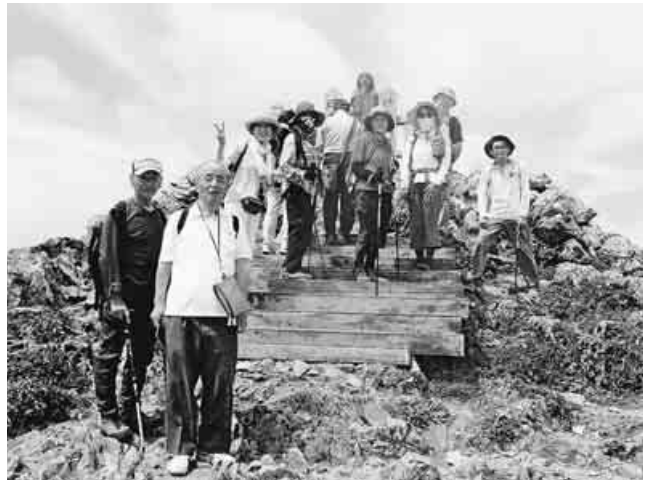
茶屋からヤマトタケル像のある頂上へ