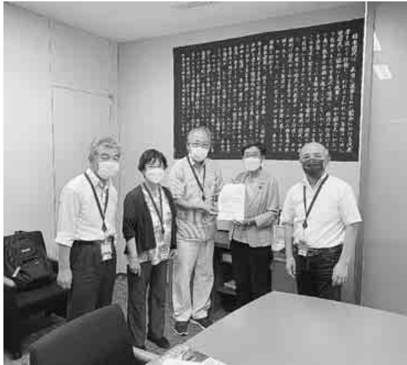
倉林議員(右から2人目)に要請書を手渡す

中央本部は9月7日、倉林明子参議院議員(日本共産党副委員長)に「物価上昇を反映できない現行ルールを見直し、2023年度の年金