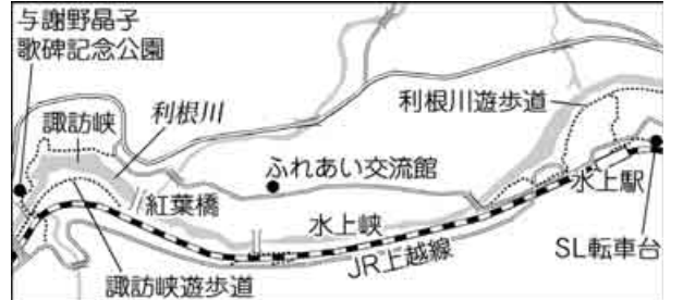
与謝野晶子歌碑記念公園