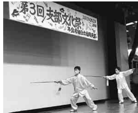
剣を使った太極拳を披露