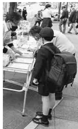
東京・巣鴨駅前署名を呼びかける声に耳を傾ける下校途中の小学生

「ロシアのウクライナ侵攻反対・一日も早い停戦と避難民支援を」と、脅威をおおりのたてて軍拡・改憲をはかる自公政権に反対して、年金者組合の仲間全国でスタンデ