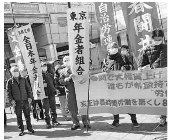
京王電鉄本社前ストライキ行動