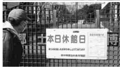
悔しいながら門越しの梅を眺めて反省。3月7日