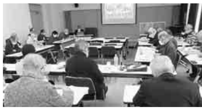
仲間ふやしを誓いあった10都府県会議

「退職者紹介ネットワークづくり運動」を生かして、退職者・退職まじかの人への声かけ、交流会など具体化を進めています。千葉県本部では地域労連役員の加入を進めるとともに地域へのチラシ宣伝や相談活動で新加入者が出ています。 生活や文化、地域づくりなど要求実現と組織拡大を結び、「いつでもどこでも誰にでも」、加入を働きかけましょう。