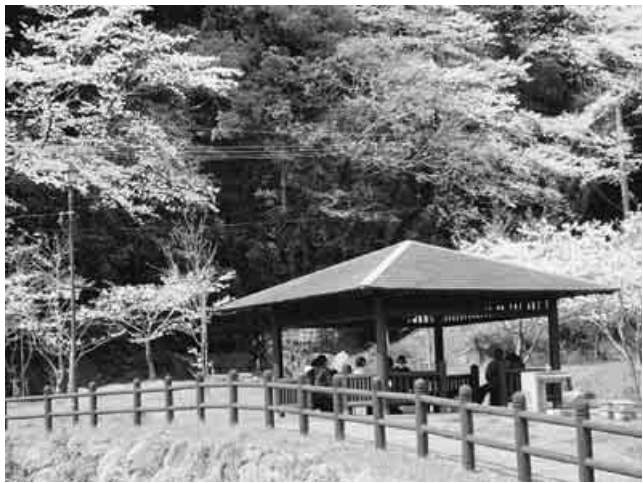
前日の大雨も止み、お花見日和に

12人でお花見会 鹿児島・始良・伊佐支部 3月27日、地元の花見公園で、お花見会。今回は弁当を食べながらゆったりと過ごせました。(城戸義郎)