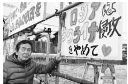
佐賀の成富家では手作り看板を掲げた

埼玉・上福岡支部では2月22日から24日まで第3回支部文化祭を行いました。コロナ禍のため大きな宣伝をしなかったのですが、延べ137人が参加、組合員以外の人も26人来てくれました。絵画、写真、手芸作品などの展示と、祝日の23日には舞台での文化祭も行いました。舞台では、いろいろな楽器で演奏する「ガチャガチャ」、詩吟、太極拳、ダンス、着付けなどが出演。太極拳には、朝霞支部からの友情出演がありました。市内の町会長が来場、