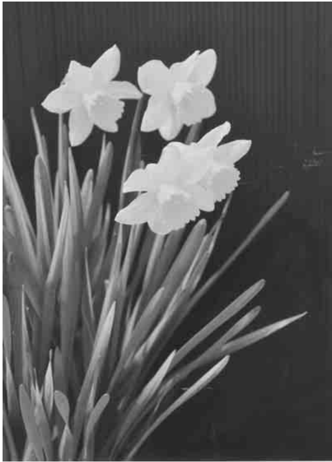
春をつげるスイセン